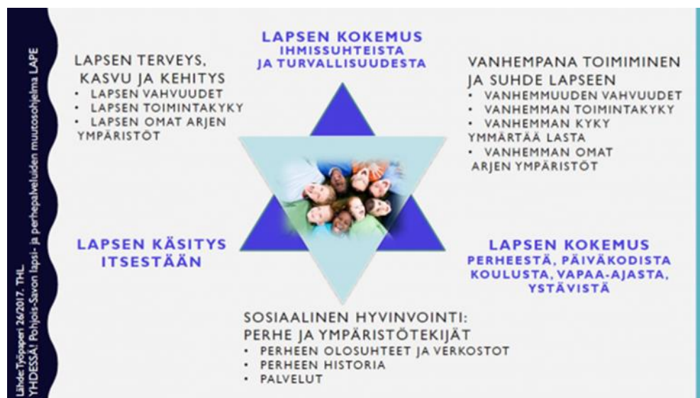
KUVA 2. Hyvinvoinnin tähti (YHDESSÄ! 2018a).

hanke. Hyvinvoinnin tähti on koottu Terveiden ja hyvinvoinnin laitoksen työpöydän pohjalta auttamaan lapsen osallisuuden huomioimisessa perhetyössä. Tämä hyvinvoinnin tähti toimii yhteisenä viitekehyksenä LAPEn pilotointi hankkeessa Monitoimijainen perhetyö ja perhekuntoutus. Malli rakentuu monitoimijaisen arvioinnin periaatteille.