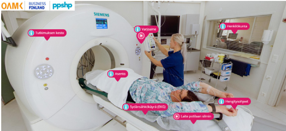
Kuva 1. Näkymä ubiikista ohjausympäristöstä.

Ubiikin ohjausympäristön käytettävyys esitettiin pilotissa syksyllä 2018, jossa OYS:aan sepelvaltimoiden TT-tutkimukseen tulevat potilaat (n=10), TT-tutkimuksia suorittaneet röntgenhoitajat (n=10) ja Oamkin röntgenhoitajaopiskelijat (n=30) saivat käyttöohjeen ja linkin ubiikkiin ympäristöön ja käyttivät ympäristöä kahden viikon ajan. Ympäristöä käytettiin tietokoneella, tabletilla tai älypuhelimella.