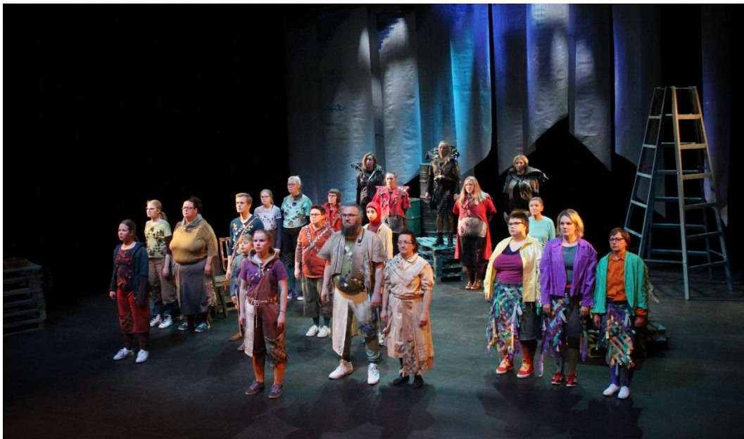
Kuva 1. Suuri hiljaisuus.

Pienen volyymin toiminnan lisäksi projektin aikana tuotettiin yhteensä viisi suurempaa esityskokonaisuutta. Esitykset olivat Hui, sähkökatkos!, Se hetki elämästä, Liisa Ihmemaassa, Sydän paikallaan –korttelidraama ja Suuri hiljaisuus. (Helsingin Kaupunginteatterin yleisötyöosasto 2018, 8.) Suuri hiljaisuus oli kokopitkä musiikkiteatterituotanto ja kolmivuotisen projektin suurin panostus. Esityksen tekoon osallistui suuri joukko jakomäkeläisiä lapsia, nuoria ja aikuisia. Lisäksi yhteistyössä toimi Helsingin Kaupunginteatterin henkilökunnan lisäksi muun muassa Pohjois-Helsingin Bändikoulu, Malmitalo ja palkattuja freelancereita. Esitys sai ensi-iltansa toukuussa 2018 ja sitä esitettiin sekä Malmitalolla että studio Pasilassa. (Helsingin Kaupunginteatterin yleisötyöosasto 2017, 2–3.)