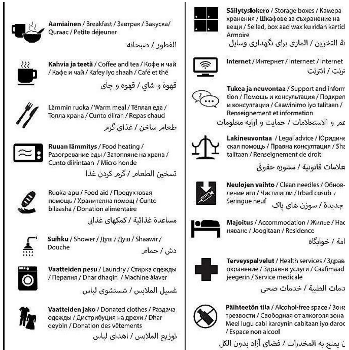
KUVA 2. "Opas kadunkansalle" -palveluoppaan sisältöä (Sininauhasäätö)

Opas on laadittu helposti ymmärrettäväksi ja on käännetty usealle kielelle: englannin, venäjän, darin, arabian, bulgarian ja somalian kielelle. Palveluoppaan tarkoituksena on tiedon jakamisen lisäksi asunnottoman ja paperittoman väestön ihmisoikeuksien parempi toteutuminen.