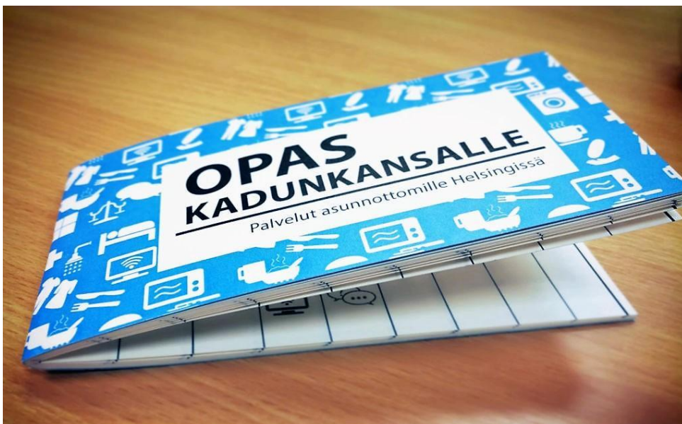
KUVA 1. Opas kadunkansalle -palveluopas (Sininauhasäätiö)

”Opas kadunkansalle” -palveluopas on laadittu yhteistyössä Sininauhasäätiön maahanmuuttajatyön Tuki ja tavoittaminen -hankkeen sekä Pop up-asumisneuvontakioski -hankkeen kanssa. Opas on taskukokoinen, selkokielinen ja visuaalinen tuote, joka on painettu vedenkestävälle paperille. Siihen on kerätty paperittomille ihmisille suunnattuja kolmannen sektorin tarjoamia palveluita, kuten esimerkiksi hätämajoitus, ruuanjakelu, peseytymismahdollisuus, keskusteluapu ja infopalvelu. Sininauhasäätiön ”Opas kadunkansalle” -palveluoppaan uudemmassa versiossa käytetään samaa mallipohjaa kuin vanhemmassa vuoden 2017 palveluoppaassa.