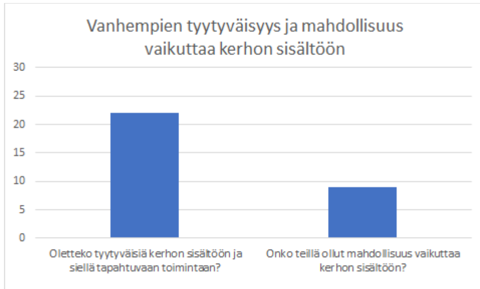
KUVIO 2 Vanhempien tyytyväisyys ja mahdollisuus vaikuttaa kerhon sisältöön (n=30)

Kyselylomakkeessa oli mukana myös orientoivia kysymyksiä, joiden perusteella kävi ilmi, että suurin osa lapsista oli käynyt seurakunnan järjestämässä päiväkerhossa vähintään vuoden. Lähes kaikista perheistä kävi päiväkerhossa yksi tai kaksi lasta. Suurin osa lapsista kävi kerhossa kahdesti viikon aikana.