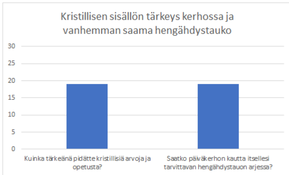
KUVIO 3 Kristillisen sisällön tärkeys kerhossa ja vanhemman saama hengähdystauko (n=30)

Vanhempien ehdottamat lisätoiveet ovat liikunta, ulkoilu, tyttöjen ja poikien yhteisleikkien järjestäminen ja mahdollistaminen, sekä ohjatun toiminnan kuten askartelun lisääminen. Kyseiset aiheet ilmenivät yksittäisissä vastauksissa. Useat vastaajat jättivät myös ilmoittamatta lisätoiveitaan. Vastauksissa kirjoitettiin ”Kerho on kiva, lapsen oma juttu. Teette arvokasta työtä!” sekä ”Ihanat ohjaajat ja hyvä kokemus jo useamman vuoden takaa. Kaikki kolme lasta käyneet kerhossa.”