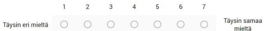
Kuva 2. Käytin vastauslomakkeessa asteikkonäkymää yhdestä seitsemään.

Rajasimme Kirkkohallituksen vuoden 2017 kyselylomakkeesta Kirkon kasvatus- ja perheasiainyksikön (KKP) rippikoulutyön asiantuntija Jari Pulkkinen kanssa väittämistä viisi, jotka erityisesti liittyvät nuorten osallisuuteen rippikoulujen hartauksissa, jumalanpalveluksissa ja konfirmaatioissa. Näiden väittämien avulla tein Messukylän seurakunnan rippikoululaisille kyselylomakkeen, jossa on viisi täysin Kirkkohallituksen vuoden 2017 lomakkeen kanssa yhdenmukaista väittämää samalla yhdestä seitsemään -arviointiasteikolla. Väittämien lisäksi laadin jokaiseen väittämään yhden tarkentavan kysymyksen (LIITE 1). Tarkentaviin kysymyksiin saatujen vastausten avulla pyrin saamaan selville konkreettisia perusteellita arviointiasteikkovastauksille. Messukylän seurakunnan rippikoulun vuonna 2018 käyneiltä sain 46 vastausta.