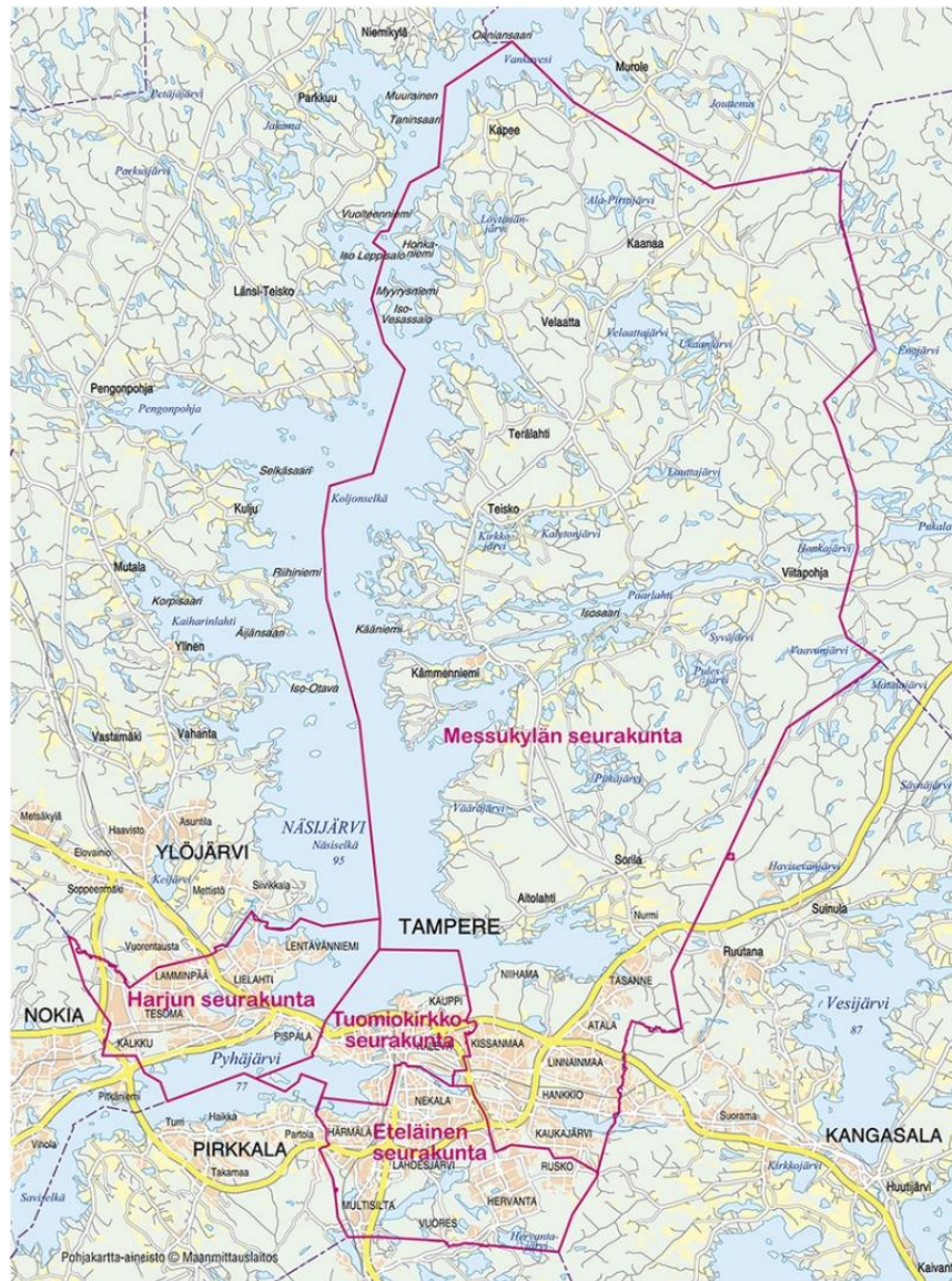
Kuva 2. Kuvassa on Tampereen kartta, josta on nähtävissä nykyiset seurakuntarajat.

jossa on avointen ovien ajatus. Kokonaisuudessaan Messukylässä pyritään kohtaamaan seurakuntalaisia laadukkaasti ja toimimaan Tampereen yhtymän strategian mukaan eli tukemaan sitä, että tamperelaisen on mahdollista olla kristitty itselleen merkityksellisellä tavalla.