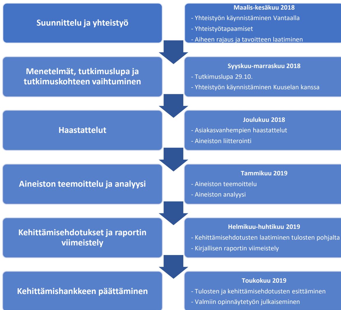
KUVIO 3. Kehittämishankkeen prosessikaavio