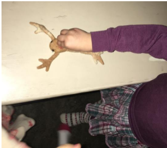
Kuva 7. Kvaaku kotimatalla (3.2019,)

Tunnin alkaessa istuin lasten kanssa oven viereen lattialle. Lauloimme alkulaulun ja tutustuimme pieneen huovutettuun sammakkoon. Lapset esittelivät itsensä sammakolle ja pohdimme seuraavaksi sammakon nimeä. Ehdotuksia tuli mm. Annasta ja Elsasta lasten omiin nimiin. Päädyimme kuitenkin Kvaaku-nimeen, jotta jokaisella olisi oma tunnistettava nimensä. Jokaiselle lapselle oli tärkeää saada pitää Kvaakua sylissään. Seuraavaksi lähdin kertomaan tarinaa metsästä ja päädyimme isojen kallioiden ja puiden lomassa liikkuen Kvaakun kotilammelle (kuva 7).