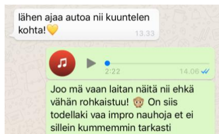
Kuva 5. Keskustelua sanelimesta löytyneistä äänitteistä 7.11.2018

Ennen kuin tapasimme ystäväni asunnolla, selasin puhelimen sanelimen läpi. Lähetin hänelle muutaman laulu ajatuksen, jotka löytyivät puhelimestani, pianoa ja lauluhyräilyjä (kuva 5).