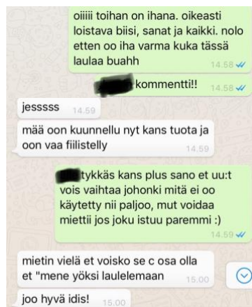
Kuva 4. Viesti keskustelua Auringolta Kuulle -laulun palautteesta, nimet on mustattu. 21.11.2018