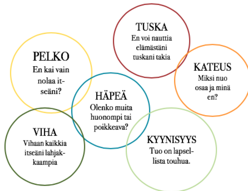
Kuva 2. Luovuutta estäviä tekijöitä eli ns. tulppia, Viljamaa (2013, 166)

Suurelta osin siihen, että en ole aiemmin tehnyt omaa musiikkia on vaikuttanut tunne siitä, etten osaa. Tämä tunne on varmasti muodostunut monista eri kokemuksista ja ajatusmalleista vuosien aikana. Ajatus siitä, että joku asia estää luovuuden esiintulon on Viljamaa esittänyt kirjassaan (2013, 166) luovuuden tulppia kuvan kautta (kuva 2). Seuraavaksi kerron esimerkkejä siitä, minkä tyyppisten asioiden olen antanut estää oman luovuuteni esiin tulemistä musiikin tekemisen saralla.