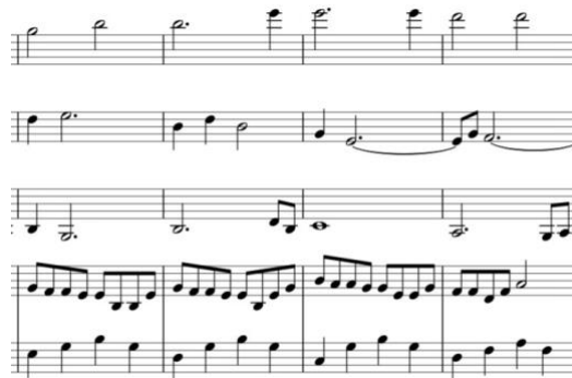
Kuva 6. Intro-sävellyksen tahdit 17-20

Kappaleessa viuluilla on melko paljon pitkiä koko- ja puolinuotteja. Eloa tuo paljon kuitenkin se, että äänet syttyvät ja vaimenevat sulavasti käyttäen hyväksi myös eri aikaan crescendoja ja diminuendoja. Nuottikuvaan näitä kaikkia ei ole merkitty, mutta ne ovat sävellettyinä kappaleen sisään. Esimerkiksi laittamalla neljäsosa- ja kahdeksasosanuotteja aika-arvoltaan pidempien nuottien väliin. Myöskin kokonuotit on joissain kohti puolitettu, jolloin kyseiseen kohtaan saadaan lisää elävyyttä (kuva 6).