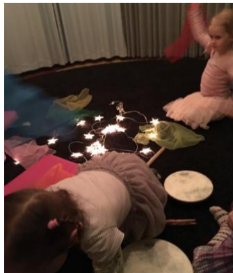
Kuva 9. Musiikin ilmentämistä ja improvisointia (3.2019, J. Haapalainen)

Jatkoin tarinan kertomista Kvaakusta ja siitä, kuinka syksyn tullen ilmojen viiletessä Kvaakku etsii itsellensä hyvän paikan, johon voi jäädä nukkumaan talven ajaksi. Kun Kvaakulle oli löytynyt sopiva paikka, pyysin lapsia sulkemaan silmänsä. Kerroin, että kun kuulet musiikin soivan voit avata silmäsi, jolloin pääsemme seuraavaksi vierailemaan Kvaakun unimaailmaan. Musiikin alkaessa soida lapset saivat mennä verhojen sisäpuolelle, jonne olin asetellut erivärisiä huiveja, rytmisoittimia, jouluvalot sekä saippuakuplia. Annoin lapsille tehtäväksi kuunnella musiikkia, mutta muuten heillä oli mahdollisuus ilmentää kuulemaansa liikkeen ja huivien avulla sekä improvisoida soittamalla rytmisoittimilla.