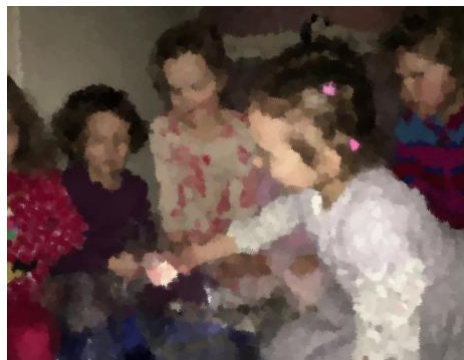
Kuva 8. Veden ääneen tutustumista (3.2019, J. Haapalainen)

Lampea kuvastin pöydällä, jonka päällä oli sininen kangas. Pöydän päällä oli myös kaksi astiaa, joissa oli vettä sekä muki. Tässä kohtaa käytin lapsille uutta laulua, Puro puhelee, säv. S. Perkiö ja san. H. Huovi. Samalla kun opettelimme ja lauloimme laulua, kuuntelimme välillä, kuinka vesi lirisee ja lorisee kaatamalla vettä astiasta toiseen mukiin avulla (kuva 8).