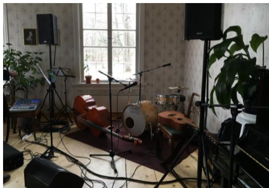
Kuva 1. Ennen Gold & Blue -konserttia Annalan Huvilalla 28.3.2019