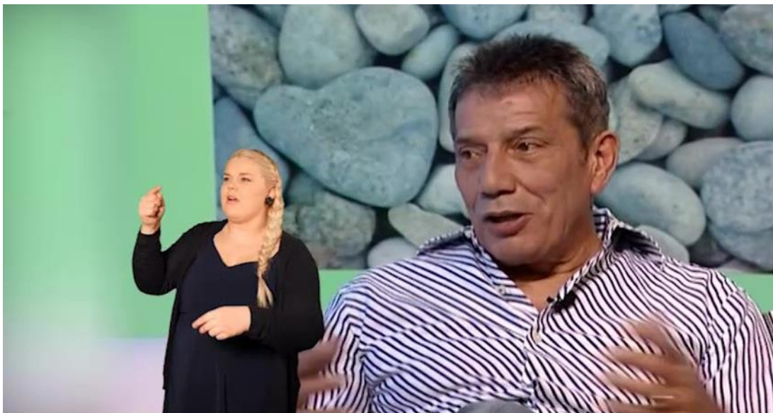
KUVA 3. Tulkin sijoittaminen suoraan haastatteluohjelmaan (kuvakaappaus videosta)

Toisessa vaihtoehdossa ohjelman kuvaruutu oli jaettu puoliksi: vasemmalla oli tulkkiruutu ja oikealla haastatteluohjelma (KUVA 4). Tulkkiruudussa tausta oli väritään harmaa. Tämä ruutu oli mielestämme myös toimiva ratkaisu, koska se ei peittänyt ohjelman kuvainformaatiota lainkaan.