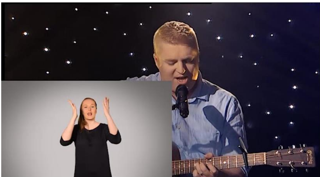
KUVA 2. Musiikkiohjelman toinen tulkkiruutuvaihtoehto (kuvakaappaus videosta)

Toisessa versiossa tulkkiruutu oli myös sijoitettu vasempaan alareunaan (KUVA 2). Tulkkiruutu oli iso ja väriltään harmaa. Mielestämme tässä versiossa tulkkiruutu oli liian iso, koska se peitti neljäsoosan kuvaruudusta. Tässä vaihtoehdossa kuvainformaatiota jäisi puuttumaan liikaa, mikä voisi häiritä katsojia.