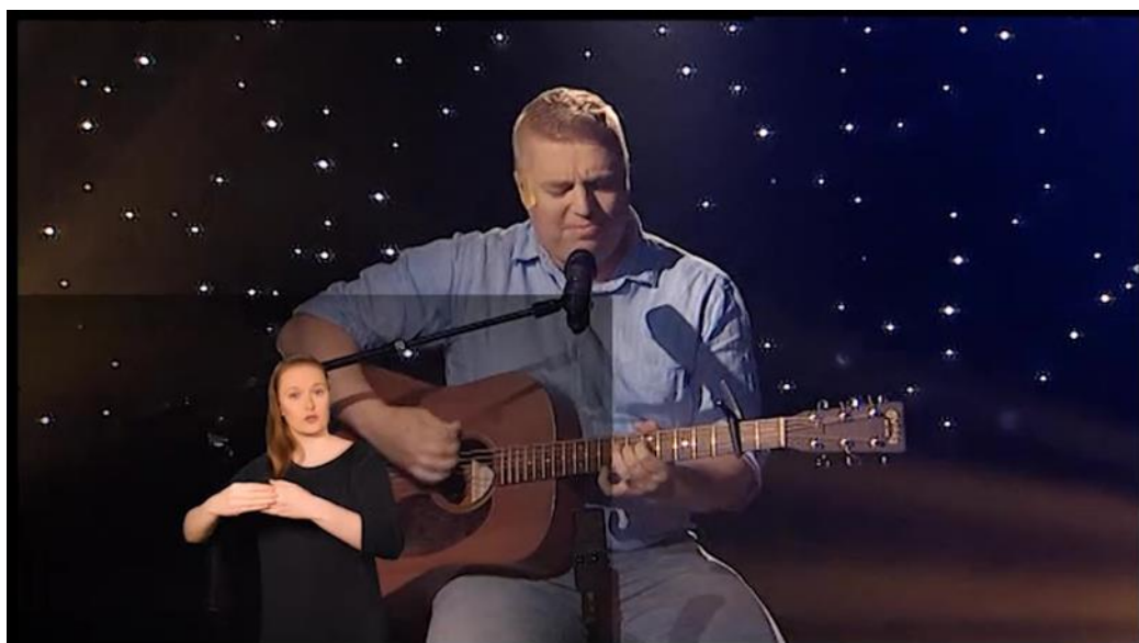
KUVA 1. Musiikkiohjelman ensimmäinen tulkkiruutuvaihtoehto (kuvakaappaus videosta)

Katsoimme musiikkiohjelman editoidut versiot. Ensimmäisessä versiossa tulkkiruutu oli sijoitettu ohjelman vasempaan alareunaan (KUVA 1).