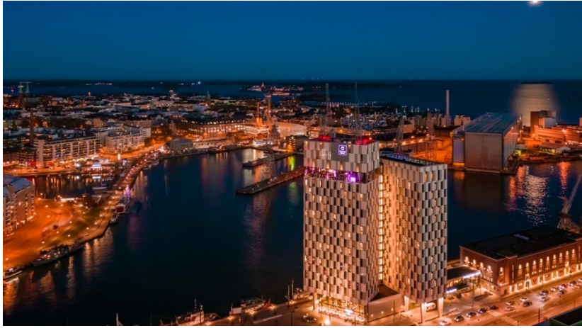
Kuva 5. Clarion Hotel Helsinki (Nordic Choice Hotels 2019)

Långvik Congress Wellness Hotel on kokous- ja kylpylähotelli, joka sijaitsee Kirkkonummen Tanskarlassa (Kuva 6). Långvikin omistaa Tanskarlan Centrum Oy. Hotelli toimii vuonna 1976 rakennetussa kiinteistössä, joka alun perin perustettiin Kansallis-Osake-Pankin koulutuskeskukseksi. Långvik aloitti toimintansa kunnostetussa kiinteistössä vuonna 2010. Långvikistä löytyy 96 hotellihuonetta, jotka on sisustettu skandinaaviseen tyyliin. Långvikistä löytyy ravintola sekä kylpylä- ja saunatilat. Hotellin asiakkaille on lisäksi mahdollisuus ostaa hyvinvointipalveluita sekä ottaa osaa erilaisiin liikunnallisiin aktiviteetteihin. Långvikissä sijaitsee 3000 neliön kokous- ja juhlatilat, joissa sekä yksityis- että yritysasiakkaat voivat järjestää tilaisuuksia. Långvikin kohderyhmänä ovat liikematkustajat, mutta hotelli haluaa samalla toimia majoitusyksikkönä aikuisille, jotka haluavat tulla rentoutumaan ja nauttimaan muun muassa hotellin kylpyläpalveluista. (Långvik Congress Wellness Hotel 2019.)