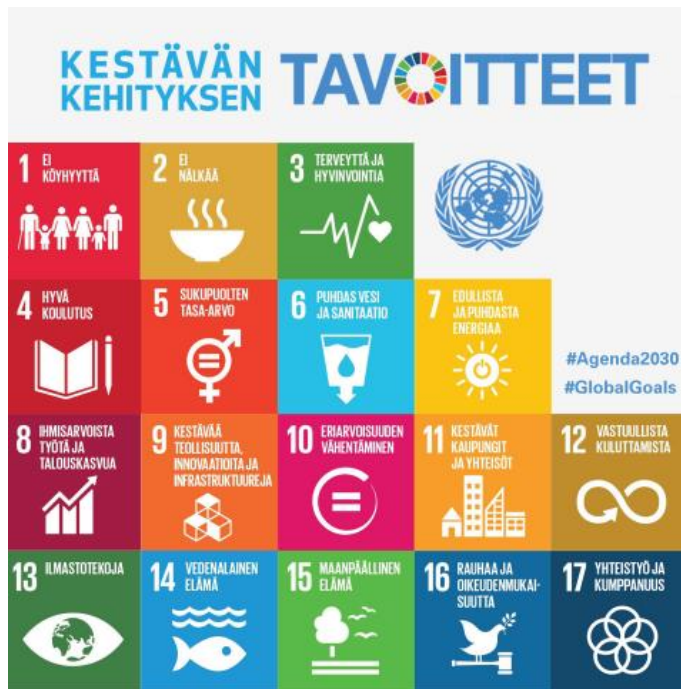
Kuva 2. Kestävän kehityksen 17 tavoitetta (Suomen YK-Liitto 2015)

sekä kehittää riskienhallintaa. Global Compact –periaatteissa käsitellään korruption torjuntaa, ympäristöä, työympäristöä sekä ihmisoikeuksia. Scandic on lisäksi allekirjoittanut Yhdistyneiden kansakuntien laatimat 17 kestävän kehityksen tavoitetta. Scandicilla on liiketoiminnassaan painopiste erityisesti neljään tavoitteeseen, jotka liittyvät sukupuolten tasa-arvoon, ihmisarvoiseen työhön ja talouskasvuun, eriarvoisuuden vähentämiseen sekä vastuulliseen kuluttamiseen. (Kuva 2.)