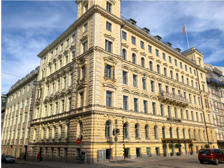
Kuva 7. Hotel St. George (Google 2019)

Hotel St. George sijaitsee Helsingin keskustassa (Kuva 7) ja se avattiin vuoden 2018 keväällä. Hotel St. George kuuluu Kämp Collection Hotels -ketjuun. Hotellin kiinteistön vanhimmat rakennuskokonaisuudet ovat valmistuneet 1840-luvulla. Hotellista löytyy 148 huonetta ja 5 sviittiä. Hotel St. Georgessa toimii kaksi ravintolaa, leipomokahvila, kylpylä sekä kuntosali ja hotellissa on mahdollisuus järjestää kokouksia sekä tapahtumia. Hotel St. Georgen kohderyhmään kuuluvat laajasti liikematkustajat ja vapaa-ajan matkustajat. (Hotel St. George 2019.)