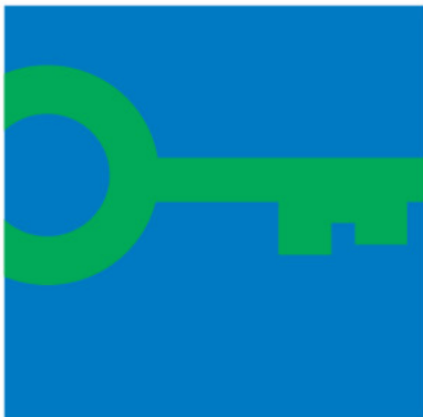
Kuva 3. Green Key -ympäristömerkki (Pohjoismainen Ympäristömerkitä 2018.)

Green Key on hotelleille tai muille majoitusalan yrityksille myönnettävä ympäristömerkki (Kuva 2). Green Key –ohjelma on kansainvälisen ympäristökasvatusjärjestön FEE:n hallinnoima ja Suomessa ympäristömerkin myöntää FEE:n omistama Suomen Ympäristökasvatus Oy. Green Key –ohjelman tavoitteena on kasvattaa majoitusalan ympäristötietoisuutta sekä edistää kestävästä matkailusta. Green Key -ympäristömerkki edellyttää, että hotelli on sitoutunut muun muassa henkilöstön ja asiakkaiden ympäristötietoisuuden kasvatamiseen, tehostamaan energian- ja vedenkäyttöä sekä pienentämään majoitustoiminnan aiheuttamaa ympäristörasitusta. Hotelli, joka hakee Green Key -ympäristömerkkiä, täytyy ensimmäisellä hakukerrallaan täyttää ympäristömerkin peruskriteerit. Tämän jälkeen Green Key -ympäristömerkin hakevan yrityksen tulee täyttää kaikki pakolliset kriteerit vuosittain sekä kasvava määrä pistekriteereitä. Mikäli kriteeri koskee toimintaa, jossa hotelli käyttää alihankkijaa tai vuokratyövoimaa, on hotellin vastuulla sitouttaa myös nämä toimijat Green Key:n mukaisiin toimintamalleihin sekä vastata heidän puolestaan merkin kriteerien toteutumisesta. Green Key -ympäristömerkki edellyttää, että hotellilla on kirjalliset dokumentit ympäristöpolitiikasta, ympäristötavoitteista sekä näihin liittyvästä toimintasuunnitelmasta. (Suomen Ympäristökasvatus Oy 2016.)