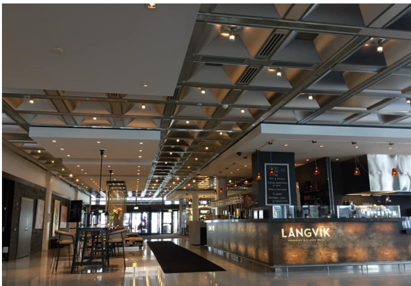
Kuva 6. Långvik -hotellin Bistron edustaa

Långvik Congress Wellness Hotel on kokous- ja kylpylähotelli, joka sijaitsee Kirkkonummen Tanskarlassa (Kuva 6). Långvikin omistaa Tanskarlan Centrum Oy. Hotelli toimii vuonna 1976 rakennetussa kiinteistössä, joka alun perin perustettiin Kansallis-Osake-Pankin koulutuskeskukseksi. Långvik aloitti toimintansa kunnostetussa kiinteistössä vuonna 2010. Långvikistä löytyy 96 hotellihuonetta, jotka on sisustettu skandinaaviseen tyyliin. Långvikistä löytyy ravintola sekä kylpylä- ja saunatilat. Hotellin asiakkaille on lisäksi mahdollisuus ostaa hyvinvointipalveluita sekä ottaa osaa erilaisiin liikunnallisiin aktiviteetteihin. Långvikissä sijaitsee 3000 neliön kokous- ja juhlatilat, joissa sekä yksityis- että yritysasiakkaat voivat järjestää tilaisuuksia. Långvikin kohderyhmänä ovat liikematkustajat, mutta hotelli haluaa samalla toimia majoitusyksikkönä aikuisille, jotka haluavat tulla rentoutumaan ja nauttimaan muun muassa hotellin kylpyläpalveluista. (Långvik Congress Wellness Hotel 2019.)