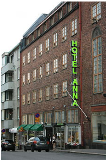
Kuva 4. Hotel Anna (Google 2019)

Hotel Anna on keskieurooppalaistyylinen hotelli Helsingin Punavuorella (Kuva 4). Hotel Annan historia kumpuaa vuoteen 1925, jolloin kiinteistö rakennettiin ja tuolloin kiinteistössä sijaitivat tilat Suomen Vapaakirkon toiminnalle ja kiinteistö toimi lisäksi Lähetys Hospiz -hotellina. Hotel Annan toiminta kiinteistössä alkoi vuonna 1985. Nykyisin Hotel Annassa on yhteensä 64 hotellihuonetta. Hotellista löytyy aamiaisravintola ja muina lisäpalveluina kokoustila, sauna sekä autohallipaikkoja hotellin vieraille. Hotel Annan kohdeyhmään kuuluvat sekä liikematkustajat että vapaa-ajan matkustajat. (Hotel Anna 2019.)