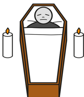
Kuva 1. Vainajan esimerkkikuva kuvaviestinnästä (Papunet 2019)

Kehitysvammaliiton Tietotekniikka- ja kommunikaatiokeskus Tikoteekki on keskittynyt tarjoamaan tietoa puhevammaisuudesta ja apuvälineitä kommunikointiin. Tikoteekki-verkoston kuuluu Papunet (papunet.fi), jonka sivustolla on vapaasti ei-kaupalliseen käyttöön tarkoitettu kehitysvammaisen kommunikointia tukeva kuvapankki (Kuva 1).