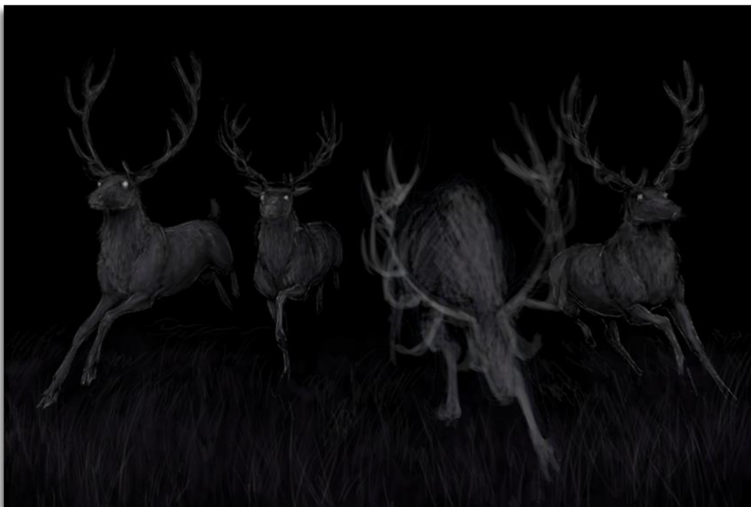
3 Että sellanen riistakamerashotti...