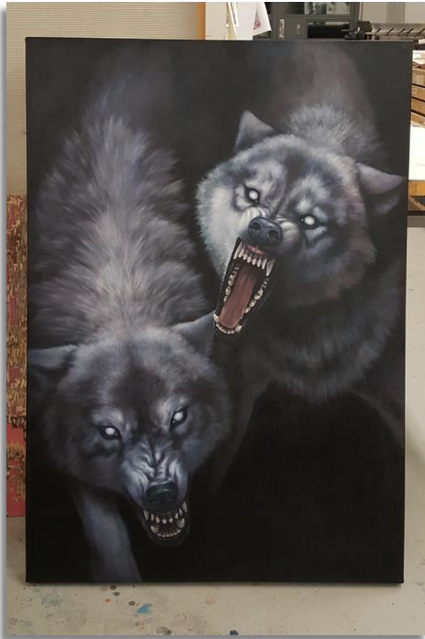
6 Melkein valmiit sudet, räyh!

ympäri koululla maalaamassa. Keskiviikkona pidinkin sitten kotipäivän ja tein uuden luonnoksen noista hirvistä valmiiksi. Yritän nuo hirvet saada järkevän näköisiksi nyt ehkä noin parissa viikossa, toivottavasti kuitenkin vähän lyhyemmässä ajassa. Kaksi viikkoa on melko ehdoton yläraja.