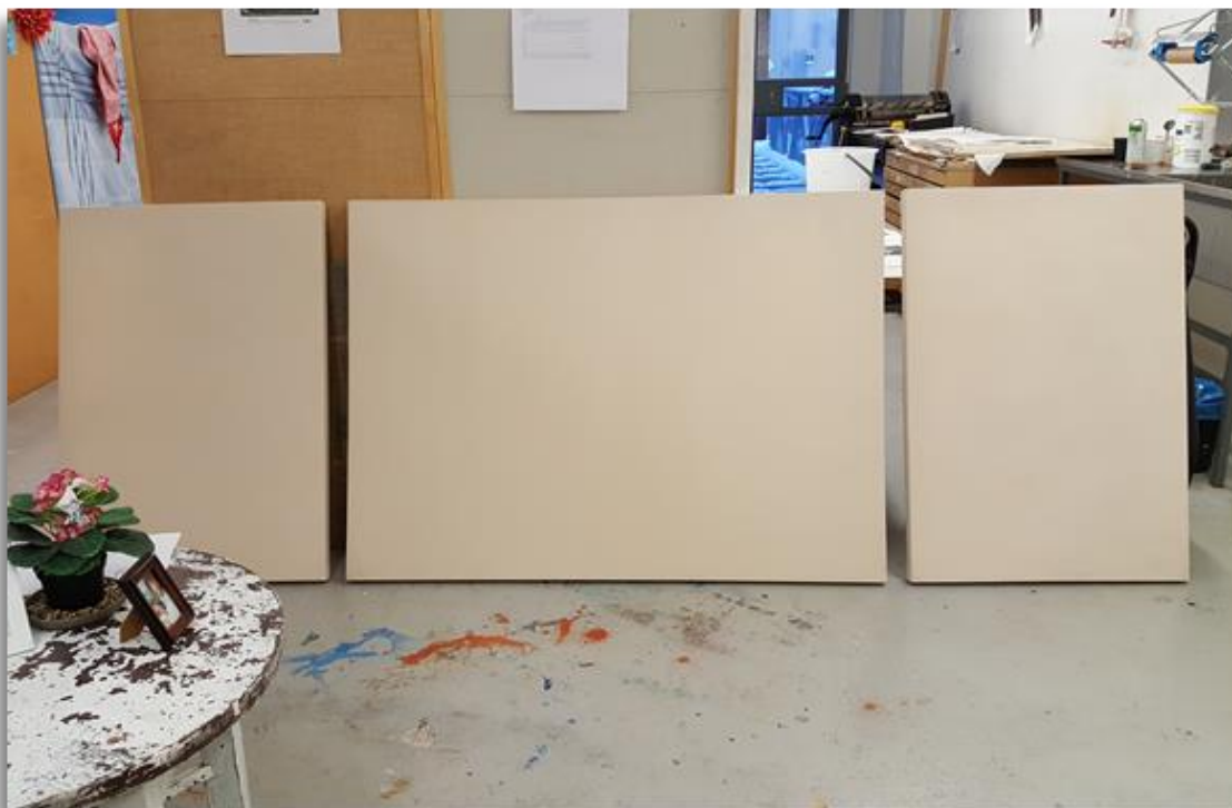
4 Apua, mitä tästä tulee...

Joka tapauksessa, pohjat ovat melkein valmiita koululla, pohjamaali vain puuttuu. Kun saan ne ja luonnokset valmiiksi, ajattelin ihan vain ruutusuurenoksen avulla siirtää tietokone-luonnokseni maalaus-pohjille. Tällä tavalla säästän vähän aikaa ja vaivaa. Katselin tänään pohjiani ja minua kyllä vähän hirvittää, miten iso keskimäinen vaa- kapohjani on. En ole koskaan maalannut niin isoa esittävää maalausta. Apua. Sen koko on siis 100x140. Kaksi muuta ovat 100x70. Pohjien kanssa tuli muuten tietysti myös vähän sählättyä. Ei mennyt taas niin kuin Strömsössä. Ensinnäkin, minulla ei ole kos- kaan aikaisemmin kangas revennyt pingottaessa, mutta nyt se repesi ja vieläpä oikein kaksi kertaa. Onko stressitaso niin korkealla, että vedän tuota kangastakin lujemmin? Toinen repeämä oli kankaan reunassa ja sen sai onneksi leikattua pois. Toinen repeämä tuli yhden niitin viereen. Vahinko oli mitättömän pieni, eikä oikeasti vaikuttanut mi- hinkään ja repeämän sai periaatteessa korjattua laittamalla toisen niitin, mutta pieni perfektionisti sisälläni olisi kuitenkin ollut jo valmis repimään kankaan irti ja vaihta- maan sen uuteen. Onneksi minulla on kavereita, jotka katsoivat minua huvittuneina ja saivat minut tajuamaan, että ei kannata. Ei se pieni repeämä mihinkään purkaudu. Se