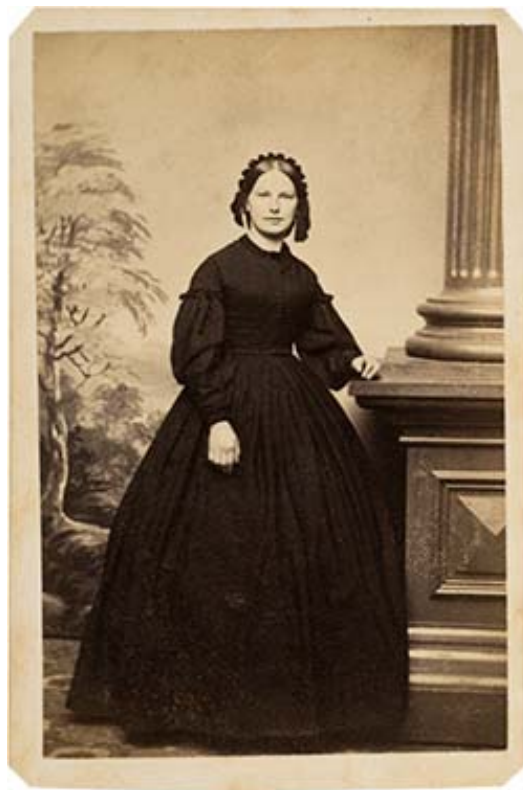
Kuva 2. Cartes de visite , 1862

Kasvava keskiluokka Yhdysvalloissa ja Euroopassa oli kuvien pääasiallisia ostajia. ”Käyntikorttien” ostamisella haluttiin näyttää materiaalin keinoin kasvavaa vaurautta ja omaa sosiaalista statusta. Cartes de visite -kortteja (Kuva 2) keräsivät sekä miehet että naiset kansioihin, joihin oli kerätty kuvia ystävistä ja sukulaisista. Kansioilla esiteltiin perheiden sosiaalisia yhteyksiä. (Buszek, 2006, 33.)