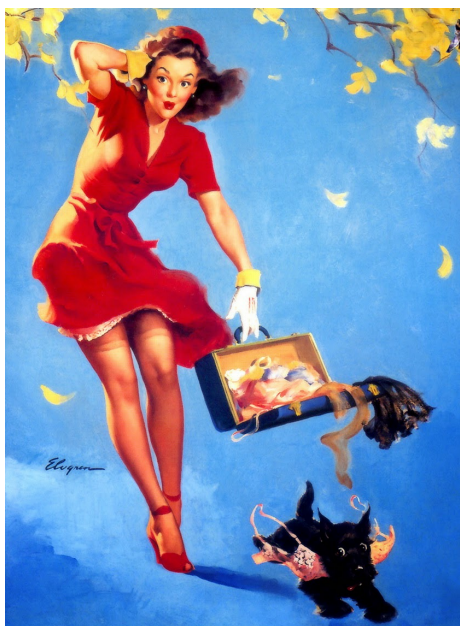
Kuva 11. Gil Elvgren pin-up , Louis F. Dow & Co , 1945

Pin-up oli trendi, joka tuotti runsaasti alkuperäistä taidetta. Brown & Bigelow'n ja Esquiren kaltaiset julkaisijat työllistivät useita taiteilijoita, jotka nauttivat suurta suosiota. Kenties tunnetuin pin-up-taiteilija oli Gil Elvgren (Kuva 11), jonka teoksissa kiteytyy koko pin-up-taiteen ydin. Kuten kollegansa Art Frahm, Elvgren maalasi