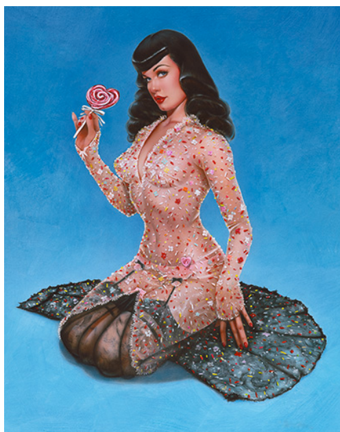
Kuva 10. Paradis , Olivia de Berardinis, 2016