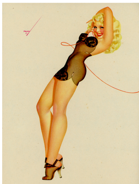
Kuva 12. August , George Petty, True Magazine , 1947

Myös skitsofreniaa sairastanut Enoch Bolles menestyi urallaan hyvin. Bolles maalasi iloisia flapper-tyttöjä ja burleskikaunottaria oudoissa tilanteissa: tykin suulla istuen tai leikkisästi villieläimen taljan kanssa seurustellen. Skitsofreniadiagnoosinsa jälkeen Bolles kävi läpi tuskaisia hoitomenetelmiä, jotka vielä 1950-luvulla olivat hyväksytyjä psykiatriassa. Hän jatkoi kuitenkin taiteen tekemistä ja myymistä vielä valtion johtamasta mielisairaalasta käsin. ( The Pin-Up Files )