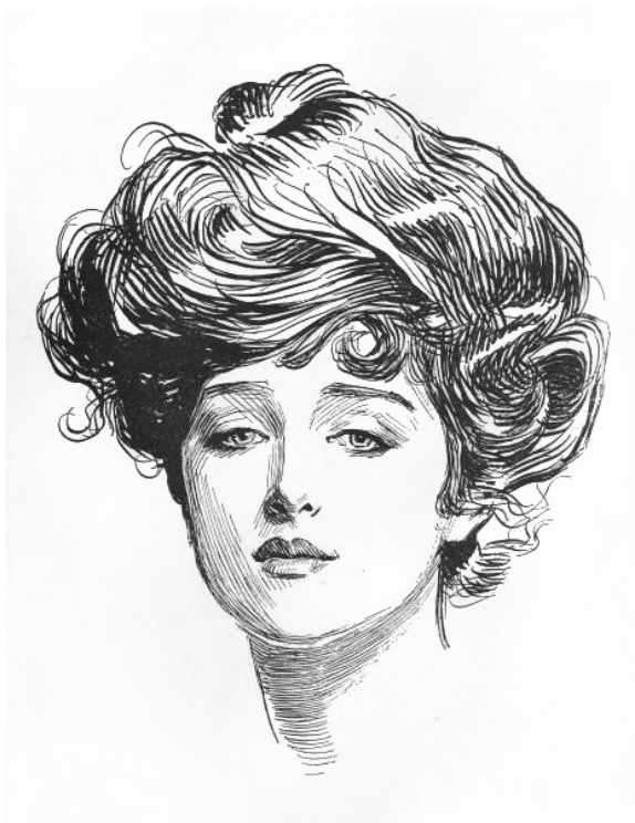
Kuva 3. Gibson Girl , Charles Dana Gibson

naisten julkista läsnäoloa ja mahdollista moraalien alenemista. (Clash of Cultures.)