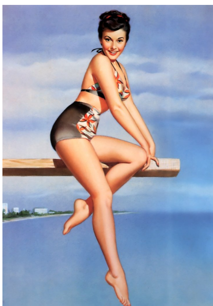
Kuva 16. Sarjasta Aquatour, 1947