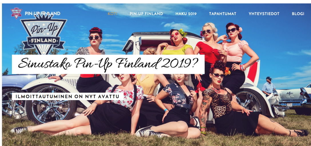
Kuva 8. Kuvakaappaus Pin-Up Finlandin kotisivulta

Myös Suomessa järjestetään vastaava kilpailu: Pin-Up Finland (Kuva 8) on Suomen ensimmäinen ja tunnetuin pin-up-alan mallikilpailu, jota on järjestetty vuodesta 2011 lähtien. Kilpailussa etsitään tulevia pin-up-malleja, jotka kokevat tyyli suunnan omakseen ja ovat pin-up-elämäntavasta kiinnostuneita. Mallit voivat olla kaiken kokoisia, mutta osallistujilla täytyy olla terveet elämäntavat, koska he toimivat esikuvina muille alalle pyrkiville. (Pin-Up Finland)