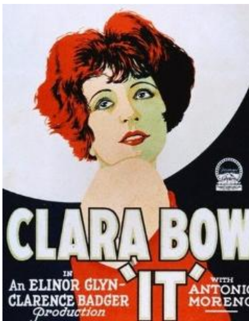
Kuva 5. It -elokuvan juliste

Paramount Studion mainososasto ylpeili näytteillepanijoille, että pin-up-kuvat toivat mainosdollareita, jotka tavallisesti olisivat menneet sanomalehtimainoksiin. Kuvien välittömyys ja tuotteet, joille ne painettiin, tarkoittivat, että yleisön suosikkitähdet olivat helposti mukana kuljetettavissa. Suurin osa elokuvista ja vastaavista pin-up-kuvista oli kohdistettu lähinnä naisille, riippumatta kuvissa esiintyvien henkilöiden sukupuolesta, sillä naisyleisöllä oli valtava rooli elokuvateattereiden menestyksessä. Samoilla massatuotantotekniikoilla, joilla Gibsonin tytön kuvia levitettiin kuluttajille, voitiin elokuvatähtien pin-up-kuvia tuottaa paperinukeista nuotteihin ja tyynypäällisistä puuterirasioihin. (Buszek, 2006, 144.)