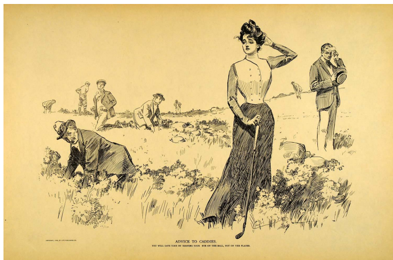
Kuva 4. Advice to Caddies , 1906, Charles Dana Gibson

Suosionsa huipulla Gibsonin tyttö vaikutti ajan muotiin, elämäntyyliin, käytöstapoihin ja jopa moraaliin. Hän esiintyi lauluissa, Broadway-näytelmissä ja painettuna mm. postikorteissa, astioissa, karamellilaatikoissa, nenäliinoissa sekä tietysti kalenteissa ja lehdissä. (Martignette & Meisel, 2011, 21.)