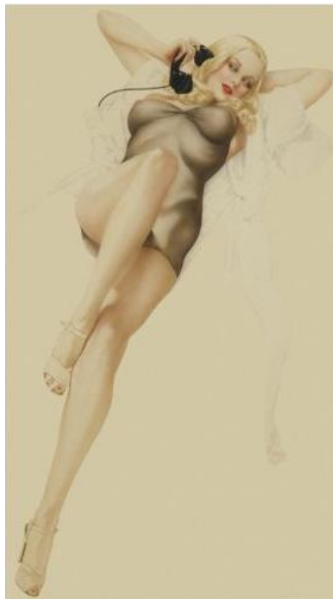
Kuva 6. Ensimmäinen Esquire ssa julkaistu Varga Girl, lokakuu 1940, Alberto Vargas.