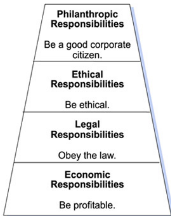
Figur 1. Carrolls pyramid om Corporate Social Responsibility

Det har argumenterats att den bäst kända illustrationen av CSR är den som illustrerats av Carroll 1991 i figuren av en pyramid. Även ifall den snart närmar sig en 30 års ålder är den än idag en av de illustrationer som används mest för att kunna simplificera CSR. Pyramiden är uppbyggd på fyra olika bas skyldigheter vilka anses vara sådana som företag bör jobba med aktivt inom sitt CSR-arbete. Skyldigheterna innefattar följande; ekonomiska, rättsliga, etiska samt filantropiska (se figur 1). (Archie B. Carroll, 2016)