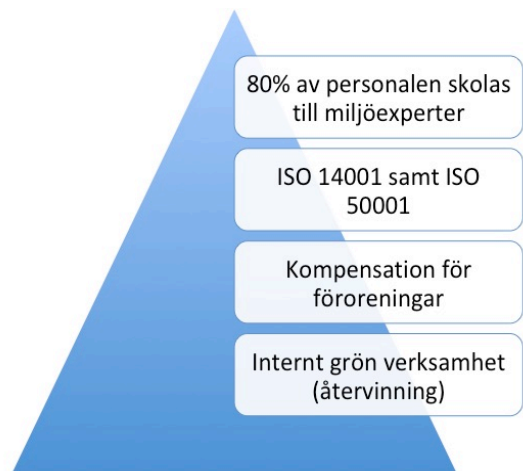
Figur 5. DHL CSR verksamhet