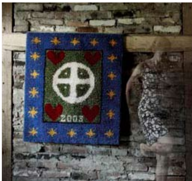
Silla-Artin valmistama vihkiryijy ”Yhteinen taival”

Silla-Art Osk Hattaratie 2, 28200 Pori puh. 040 522 5385 sähköposti: eva.grohn@dnainternet.net www.taitajat.fi/sa Toimitusjohtaja Eva Gröhn