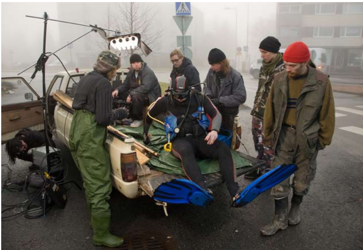
Villilä Korporaation jäseniä Kalamies-lyhytelokuvan kuvauksissa marraskuussa 2009.

Villilä Korporaatio tuottaa mainoselokuvia sekä musiikki- ja yritysesittelyvideoita. Näiden lisäksi osuuskunta tarjoaa paljon muita audiovisuaalisia palveluja ja tuotteita. Tilaustöiden ohella yritys tuottaa omia tuotantojaan, esimerkiksi lyhytelokuvia, videotaitetta sekä muita tuotantohankkeita.