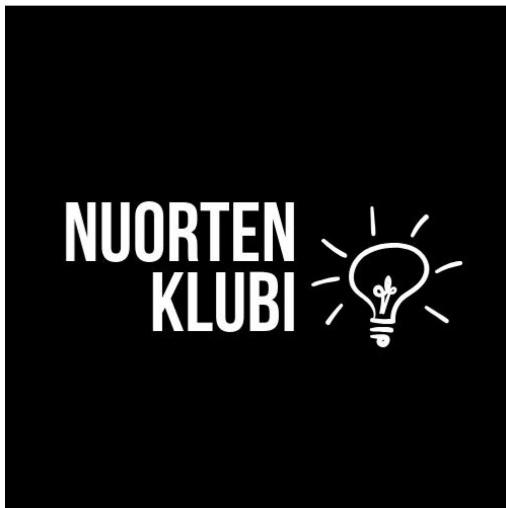
LIITE 3 Nuorten mediaryhmäläisen tekemä tilaustyö (logo)