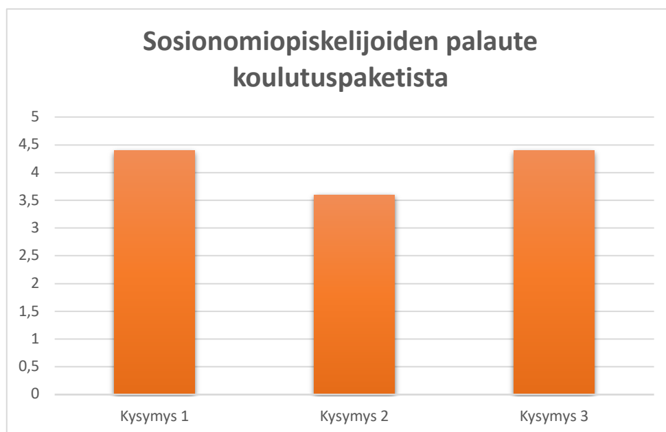
Kuvio 3: Sosionomiopiskelijoiden palaute koulutuspaketista

Sosionomiopiskelijoiden palaute koulutuspaketista koostuu ensimmäisestä, 1,5 tuntia kestäneestä koulutuspaketin pilotoinnista, johon osallistuivat lastensuojelun ja perhetyön kursseilla opiskelevat Laurea-ammattikorkeakouluopiskelijat. On huomioitavaa, että näihin opintojaksoihin osallistujien joukossa on saattanut olla myös muita, kuin sosionomiopiskelijoita, sillä molemmat kurssit ovat vapaavalinnaisia, vaikka ne ovatkin suunnattu sosionomiopiskelijoille. Käytämme kuitenkin selvyuden vuoksi sosionomiopiskelija-termiä tässä yhteydessä.