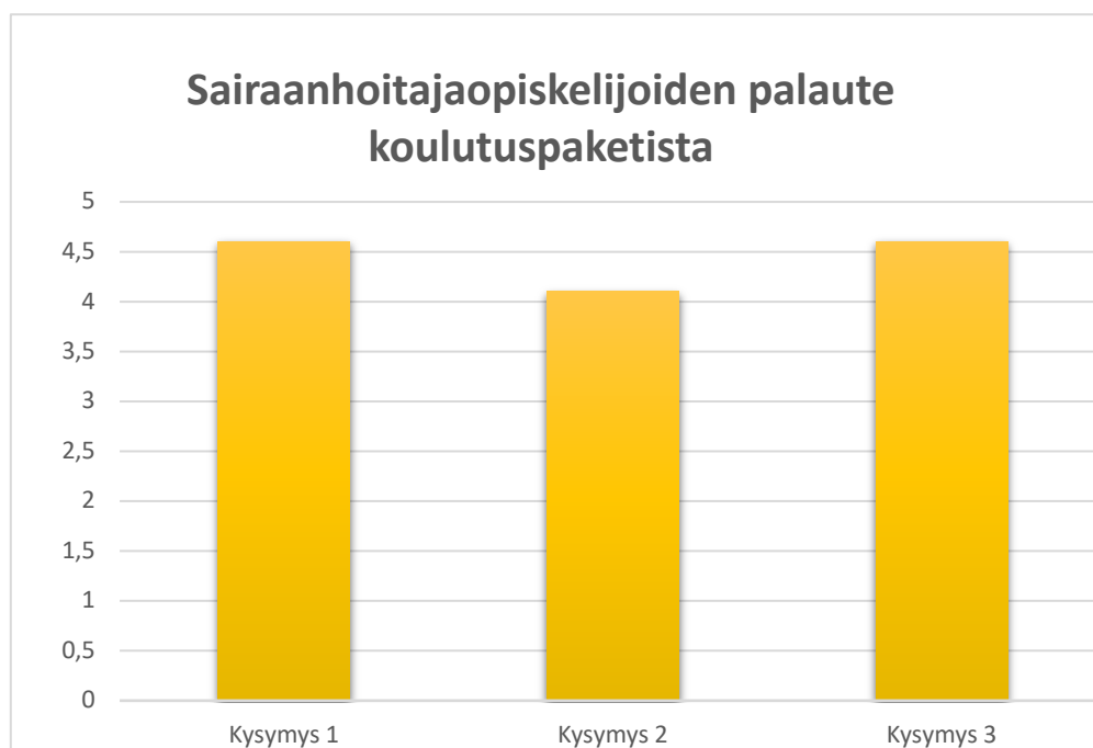
Kuvio 4: Sairaanhoitajaopiskelijoiden palaute koulutuspaketista

Sairaanhoitajaopiskelijoilta saatu palaute (Kuvio 4) koostuu toisesta, 2,5 tuntia kestäneestä pilotoitinkoulutuksesta kerätyistä palautteista. Kyseinen pilotoitinkoulutus oli osa Porvoon Laurea-ammattikorkeakoulun sairaanhoitajaopiskelijoiden pakollista kurssia. Tämä koulutuspaketin pilotointi sisältää myös case-työskentelyn toisin kuin sosiaali-alan opiskelijoiden pilotoitinkoulutus, sillä käytettävissämme oli enemmän aikaa. Tämä sisällöllinen eroavaisuus suhteessa sosiaali-alan opiskelijoista saatavaan palautteeseen on otettava siis huomioon palautteita tarkasteltaessa. Sairaanhoitajilta saimme yhteensä yksitoista palautetta, joista jokaiseen kysymykseen oli vastattu.