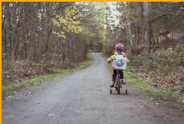
Ensi- ja turvakotien liiton & Veikkauksen Nalleretki -video