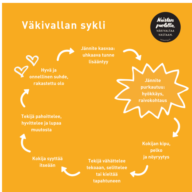
Kuvio 1: Parisuhdeväkivallan sykli

Ilmiön esittelyn jälkeen käydään läpi naisiin kohdistuvan väkivallan muodot, jotta koulutettavat saavat ymmärrystä siitä, mitä kaikkea