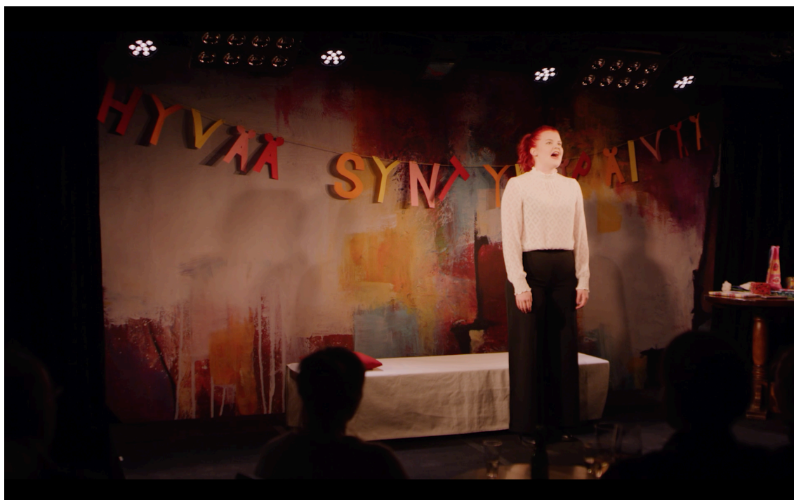
KUVA 2. Jos lähdenkin huomenna -musiikkiteatteriesitys.

Esityksen työnimi oli Ennakkomuistotilaisuus. Emme olleet vielä päättäneet, järjestääkö päähenkilö muistotilaisuuden itselleen vai jollekin läheiselleen, mutta tämän teeman ympärille lähdimme kehittämään tarinaa.