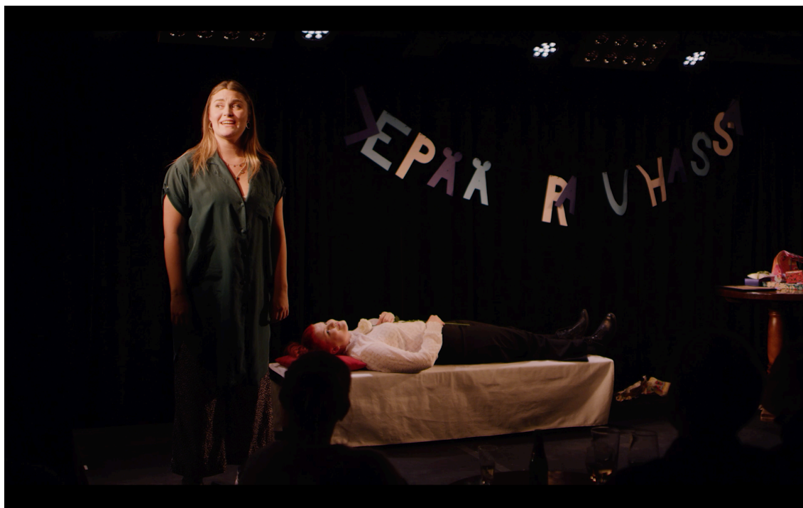
KUVA 3. Esitys Kulttuuriravintola Kivessä 6.3.2019.

vaihetta. Selinin mukaan aluksi ihminen kohtaa sokkivaiheen, jota seuraavat reaktiovaihe, käsittelyvaihe ja sopeutumisvaihe. Jos lähdenkin huomenna –esityksessä päähenkilö kieltäytyy tuntemasta yhtään mitään ja pakottaa itsensä hypäämään kaikkien näiden vaiheiden yli, jolloin väistämättäkin tulee vaikeuksia.