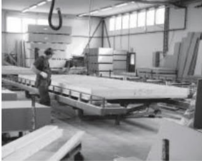
Kuvio 2. Siirtämällä tuotantoa teollisuushallien hallittuihin olosuhteisiin voidaan rakentamista nopeuttaa sekä parantaa rakentamisen laatua ja työolosuhteita (Viljakainen 2001, 12)