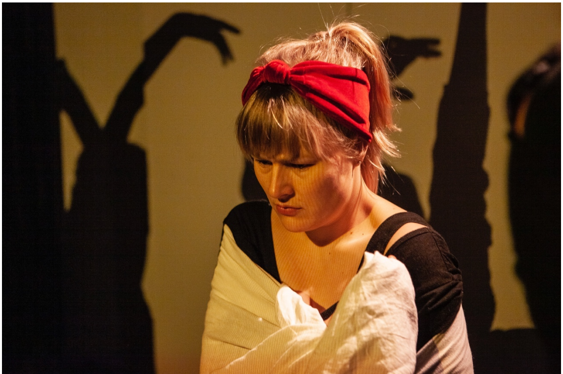
Kuva 2. Promo-kuva esityksestä 10 kohtausta seksuaalisesta vallankäytöstä.