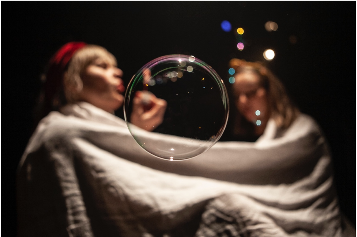
Kuva 3. Promo-kuva esityksestä 10 kohtausta seksuaalisesta vallankäytöstä.