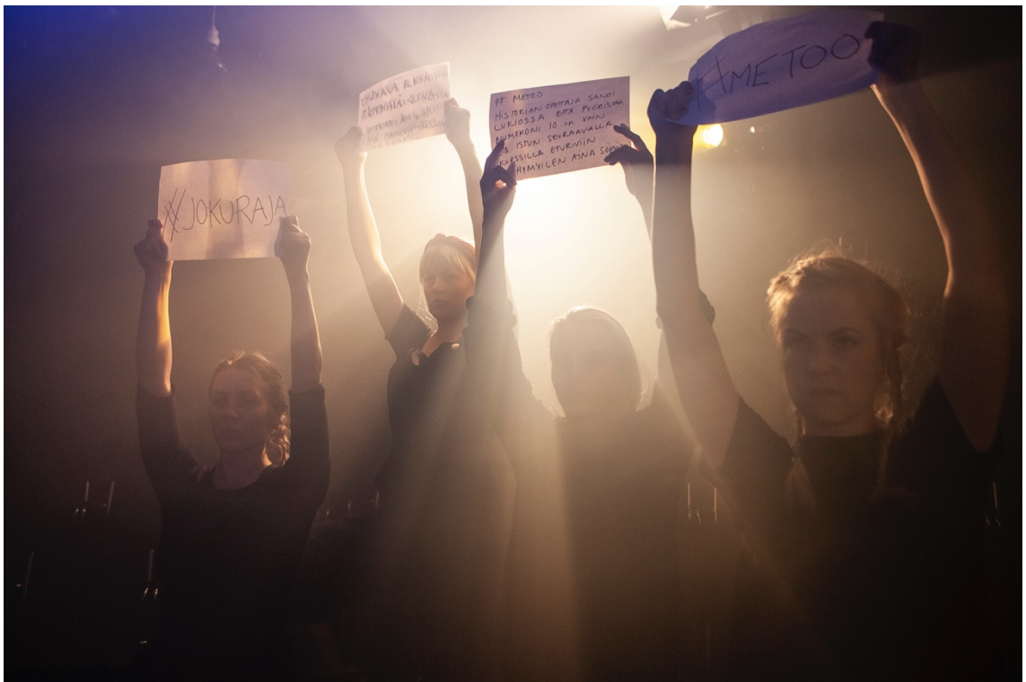
Kuva 4. Promo-kuva esityksestä 10 kohtausta seksuaalisesta vallankäytöstä.