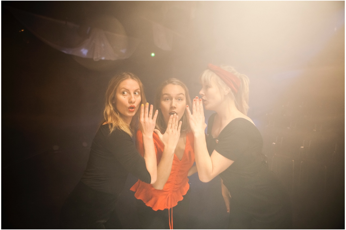
Kuva 1. Promo-kuva esityksestä 10 kohtausta seksuaalisesta vallankäytöstä.