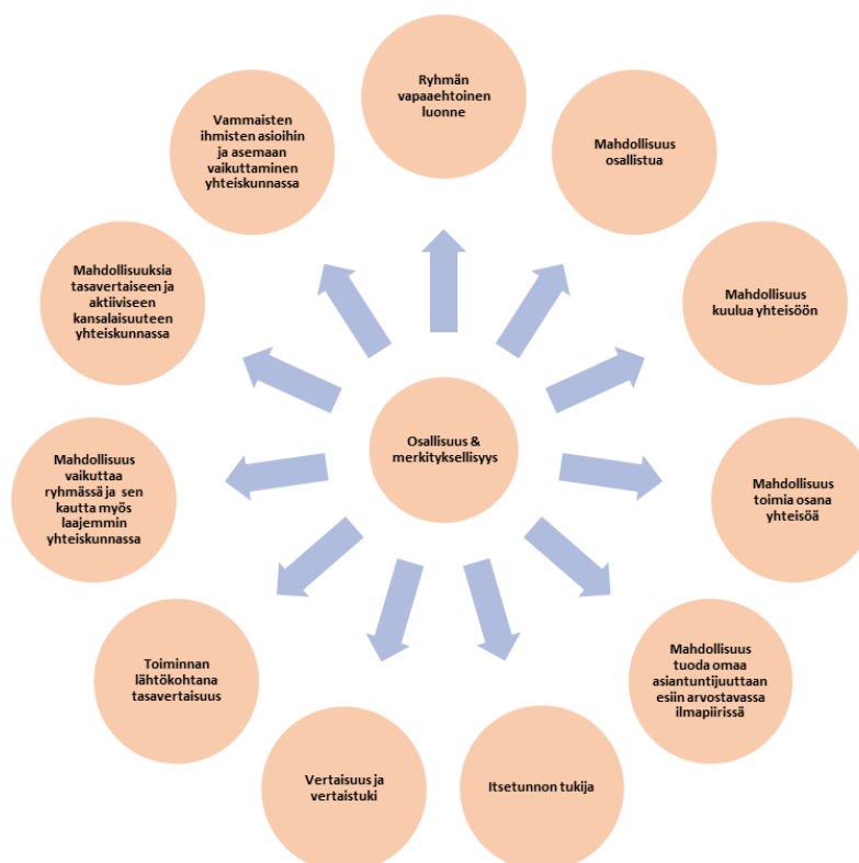
KUVIO 2. Yhteenveto jäsenten osallisuutta tukevista ja merkityksellisyyden kokemuksia luovista teemoista asiantuntijaryhmässä

on voida vaikuttaa laajasti vammaisia ihmisiä koskeviin yhteiskunnallisiin asioihin tasavertaisena toimijana sekä vertaistensa että muiden ihmisten kanssa.