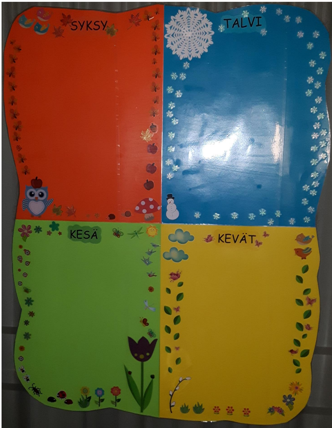
Liite 3: Kuva laatimastani päivähoitoyksikön kulttuuri- ja juhlakalenterista