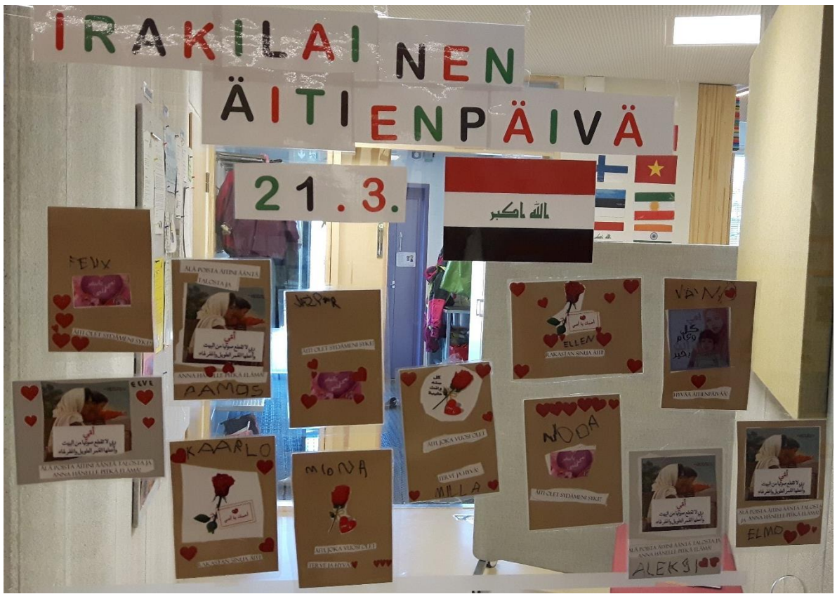
Liite 1: Irakilaisten äitienpäiväkorttien kollaasi päivähoitoryhmän lasioveassa