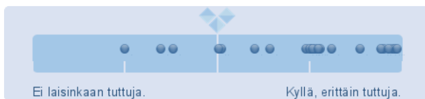
Kuvio 3. Ovatko nuoren vanhemmuuden haasteet sinulle tuttuja? Vastausten jakaantuminen Likertin asteikolle.

Vastauksena kysymykseen ovatko nuoren vanhemmuuden haasteet sinulle tuttuja, vastaajat kokivat olevansa varsin hyvin perillä nuoren vanhemmuuden erityisyydestä. Keskiarvo vastausasteikolla 1 (=Ei laisinkaan tuttuja) - 5 (= Kyllä, erittäin tuttuja) oli 3,96 keskihajonnan ollessa 0,84, eli vaihtelua oli varsin vähän. Vastaukset sijoittuvat Likertin asteikolla seuraavasti: