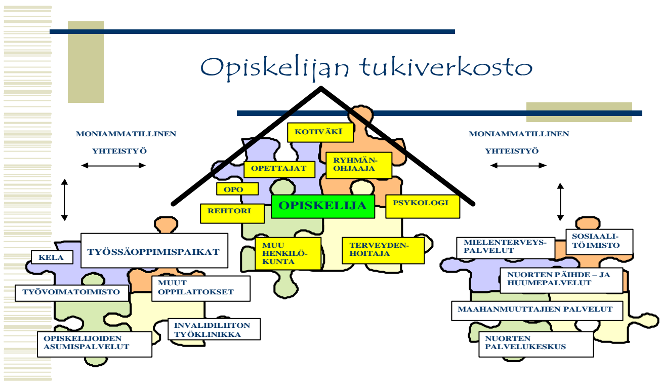
Kuvio 2 Opiskelijan tukiverkosto Jyväskylän kotitalousoppilaitoksessa (Jyväskylän kotitalousoppilaitos kotisivut).

vastaava/koulupsykologi ja erityisopetuksen pajarvetäjä osallistuvat viikoittain ryhmänohjaajien opiskelijahuoltokatsaukseen, jossa käsitellään ajankohtaisia opiskeluun ja opetukseen liittyviä tuen tarpeita. Viikkopalaverin pohjalta suunnitellaan tarvittavat tukitoimet sekä oppilaitoksen että ulkopuolisten yhteistyötahojen kanssa. Opiskelijahuollon välittömänä tukena (kuvio 2) toimii moniammatillinen yhteistyöverkosto, jonka avulla tarpeen mukaan tuetaan opiskelijaa. (Heiskanen-Nikula 2006.)