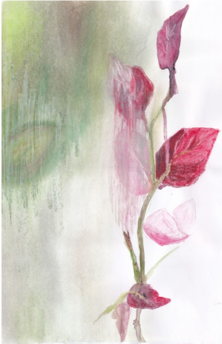
KUVA 12. Varvut – luonnos

Taidetekstiiliin aloin minulle ominaisella tavalla etsiä ideoita valokuvaamalla. Kuvien kautta pääsen lähemmäksi kyseessä olevaa aihetta, jonka jälkeen minulla on runsaammin ideoita luonnosteluvaiheessa. Aluksi pyrin luonnostelemaan kaikki mahdolliset mielikuvat paperille, joita minulla oli mielessä taidetekstiilistä. Tiesin, että nämä ideat saattaisivat jäädä pois luonnosten edetessä, tai että niistä saattaisi löytyä yllättäen jokin mielenkiintoinen kohta. Ensimmäisissä luonnoksissa minulla oli muutamia vahvoja mielikuvia, jotka oli tuotava paperille, ennen kuin saatoin jatkaa eteenpäin. Näissä oli paljon suoria yhteyksiä asiakkaan toiveisiin taidetekstiilistä, kuten mustikan varvut (kuva 12) ja (kuva 13).