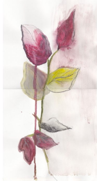
KUVA 13. Varvut - luonnos 2

Luonnoksissa koetin tuoda esille myös leikkimielisyyttä, josta asiakas oli maininnut mutta koin tämän hankalana, koska hauskuus ja leikkimielisyys voivat kattaa niin monenlaisia asioita eri näkökulmista katsottuna. Niinpä nämä kivipino- luonnokset (kuva 14) ja (kuva 15) jäivät pian pois