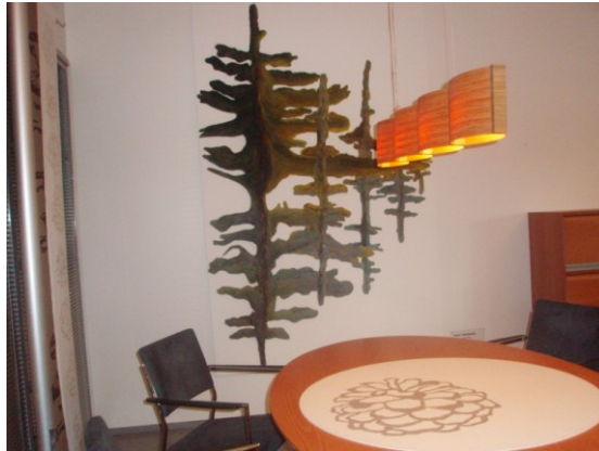
KUVA 4. Katve- taidetekstiili Microtekniilla

Lisäksi olen valmistanut Tutuilla teillä - taidetekstiilin (kuva 5) sekatekniikalla, joka pääsi Utopia ja kotiinpaluu – Muotoilua tulevaisuuden kotiin, näyttelyyn Kuopion Muotoiluakatemialle. Näyttely oli Kuopion Rouvasväen yhdistyksen 150- vuotis juhlanäyttely, jonka ajankohta oli 20.5- 30.9.2010.