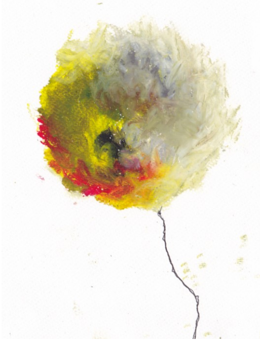
KUVA 22. Kuulas – luonnos