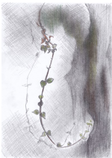
KUVA 16. Kallio – luonnos