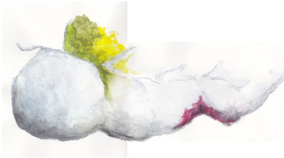
KUVA 26. Muodon hakemista luonnoksessa

Luonnosteluvälineitä vaihtamalla löytyi usein jokin uusi näkökulma aiheeseen. Koska pidin Kuulas – (kuva 22) ja Kuura - luonnoksista (kuva 23), päädyin kokeilemaan myös samaa luonnostelu tekniikkaa lehtien luonnostelussa. Aluksi hain lisää lopullista muotoa (kuva 26) ja värit jäivät myös hyvin vaaleiksi (kuva 27).