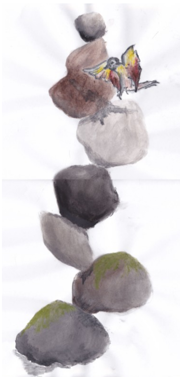
KUVA 14. Kivipino – luonnos

jatkoluonnostelusta. Osaksi myös sen myötä, etten kokenut kivi ja kallio luonnoksia (kuva 16) enempää omakseni toisten luonnosten rinnalla.