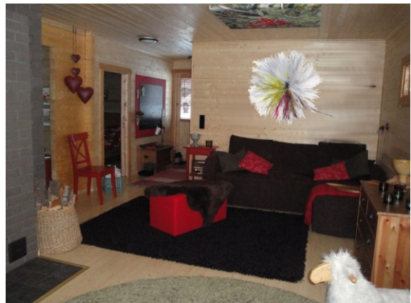
KUVA 30. Kuulas, esityskuvassa mökin seinällä KUVA 31. Kuura, esityskuvassa mökin seinällä

Haave valikoitui yhdeksi vaihtoehtoksi erilaisen muodon ja sisustukseen sekä tunnelmaan sopivuuden vuoksi. Ensimmäisessä Haave- luonnoksessa (kuva 32) tulee esille taiteellisuus, lehden säröinen muoto ja hyvin valkoiset sävyt. Toisessa Haave – luonnoksessa (kuva 33) kuvastuvat pehmeät, kermansävyt ja tavanomainen muotokieli.