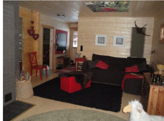
KUVA 11. Mökin olohuone, edessä taidetekstiilille varattu tila.