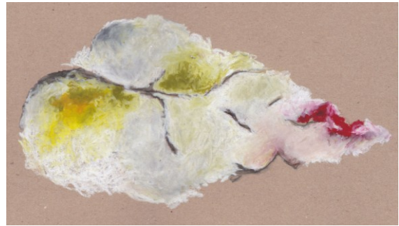
KUVA 27. Vaalea sävyinen luonnos

Lopulta koin olevani niin pitkällä lehtien luonnostelussa, etteivät ne enää edenneet. Koin, että olin saavuttanut niiden lopullisen muodon ja värin paperille. Luonnos sai nimekseen Haave (kuva 28).