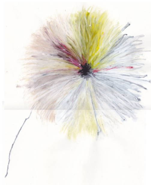
KUVA 25. Vaalea variaatio Kuura – luonnoksesta