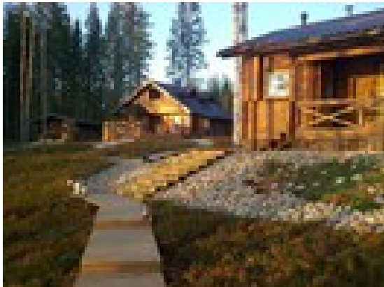
KUVA 10. Mökki ja sitä ympäröivät rakennukset.