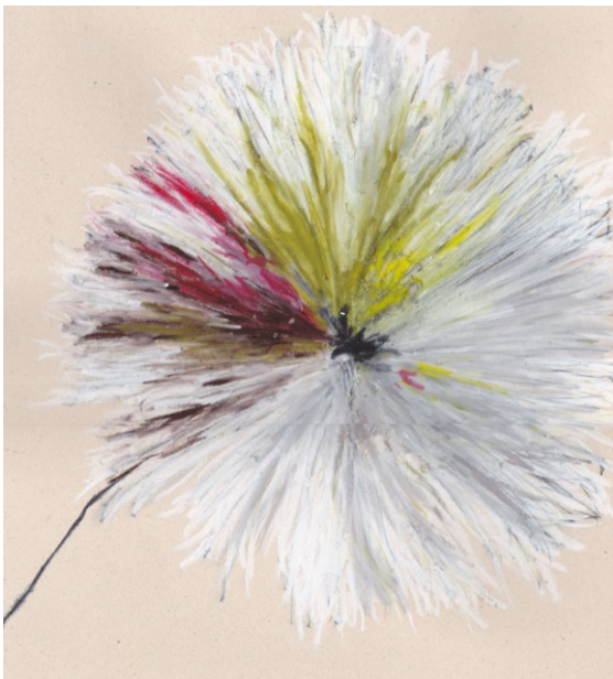
KUVA 24. Kuura - luonnos

Kuulas- luonnos saavutti toisen muodon kirkkaiden ja vaaleiden sävyjen yhdistelmänä, jolloin se ikään kuin sai pinnalleen pakkasen luoman kuuran. Kuura – luonnoksessa (kuva 24) yhdistyvät myös tämän taidetekstiilin vaatimat värit. Lisäksi tein luonnoksesta vaalean kerman sävyisemmän väri- variaation (kuva 25).