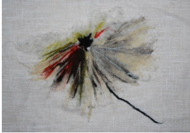
KUVA 36. Materiaalikoikeilu Kuura luonnoksesta

Asiakastapaamisessa syksyllä 2010, asiakas valitsi taidetekstiilin mökilleen Haave – luonnoksen pohjalta (kuva 28) ja (kuva 33). Hän piti eniten esittävästä, selkeästä muodosta. Lisäksi asiakas toivoi, että lisäisin lehteen hieman lisää ruskeaa, valkoista kerman sävyjen tilalle ja vihreää keltaisen tilalle. Asiakas oli luottavaisin mielin ja sanoi että voin itse lisätä työhön kolmiulotteisuutta sopiviksi katsomiini kohtiin. Lisäksi päädyimme, ettei syksyllä lähdetä Heinävedelle saakka sovittamaan 1:1 luonnosta taidetekstiilille varatulle tilalle, vaan sinne asetetaan vasta valmis työ.