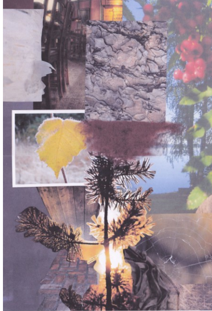
KUVA 7. Mielikuvakartta, Kaipaus

Kaipaus (kuva 7) on syksyn etenemistä, sen kuulautta ja kirpeyttä. Auringon kirkkaus muuttuu laskevaksi auringoksi ja himmeämmäksi, värit hämärtyvät kirkkaiden värien tieltä.