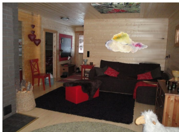
KUVA 32. Haave, esityskuvassa mökin seinällä KUVA 33. Haave, esityskuvassa mökin seinällä