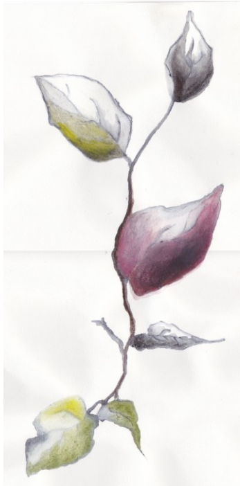
KUVA 21. Oksa - luonnos

Oksa- luonnos (kuva 21) ja Varjoisa – oksa luonnos (kuva 22) muodostuivat varpujen ja lehtien yhdistelmästä. Ne saivat edetessään hauraamman muodon, säilyttäen kuitenkin väriominaisuudet taidetekstiiliin nähden.