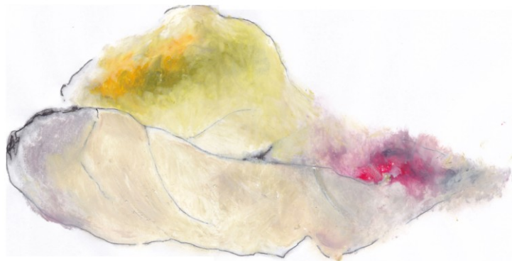
KUVA 28. Haave - luonnos

Siinä näkyvät jäljet menneestä syksystä ja tulevasta talvesta mutta myös haaveet tulevasta kevästä ja kesästä. Valkoisempi, epätasaisempi variaatio muodostui edellisen rinnalle (kuva 29).