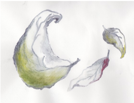
KUVA 17. Lehdet – luonnos

Luonnostelussa koen omakseni herkän, maalauksellisen jäljen, joka useimmiten tulee paremmin esille kehitellessäni luonnoksia yhä pidemmälle. Varpuja luonnostellessani, ne muuntuivat vähitellen lehdiksi (kuva 17) ja lehtien eri versioiksi varjoineen (kuva 18) sekä yksittäisine muotoineen, kuten Lehti - luonnos (kuva 19) jota kehittelevin yhä eteenpäin. Toisaalta luonnoksista muotoutui lehtien ja oksien yhdistelmiä, niin kuin Pieni oksa - luonnos (kuva20).