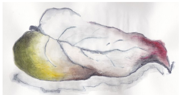
KUVA 18. Lehti ja varjo – luonnos