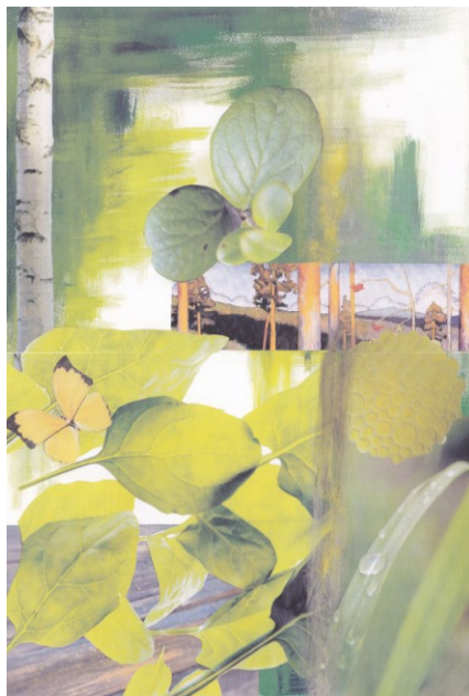
KUVA 6. Mielikuvakartta, Vehreys

Mielikuvakartat painottuivat aiheiltaan syksyyn, asiakkaan mieluisimpaan vuodenaikaan, jonka jaoin kolmeen osaan sekä värien että ajan mukaisesti. Mielikuvakartoista Vehreys (kuva 6) on alkusyksyn vihreyttä, puiden ja kasvien värien vaihtumista keltaiseksi ja ruskan väreiksi. Siitä löytyy suomalaisen luonnon eri elementtejä karusta mäntymetsästä loppukesän vehreyteen.