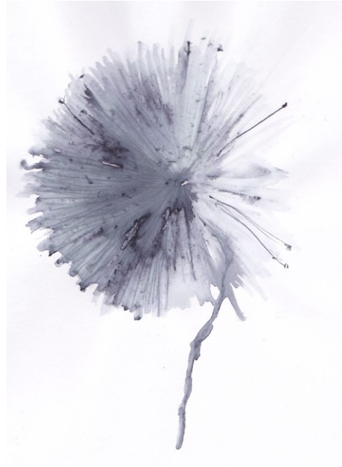
KUVA 23. Mustavalkoinen Kuulas – luonnos

Kuulas- luonnos saavutti toisen muodon kirkkaiden ja vaaleiden sävyjen yhdistelmänä, jolloin se ikään kuin sai pinnalleen pakkasen luoman kuuran. Kuura – luonnoksessa (kuva 24) yhdistyvät myös tämän taidetekstiilin vaatimat värit. Lisäksi tein luonnoksesta vaalean kerman sävyisemmän väri- variaation (kuva 25).