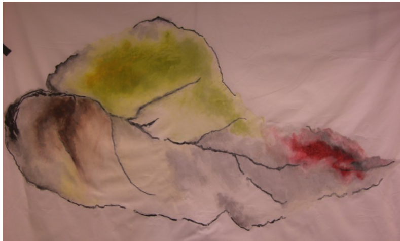
KUVA 37. Haave - luonnos 1:1 maalattuna

Maalasin valkealle kankaalle 1:1 luonnoksen, jonka koko oli 75 cm x 150 cm asiakkaan toivoman ja taidetekstiilille varatun tilan mukaisesti (kuva 37). Maalaus oli hyvä apuväline neulahuovutettaessa suurta työtä, sillä maalauksesta voi seurata värien sulautumista toisiinsa ja kohdentaa ne suuressa työssä niille tarkoitetuille paikoilleen.