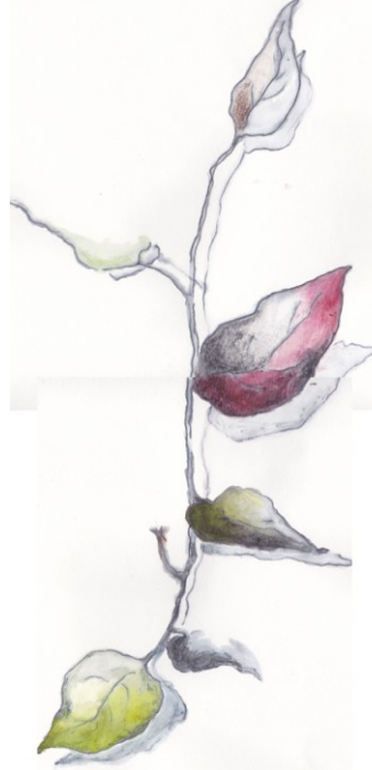
KUVA 22. Varjoisa oksa – luonnos

Pohdittuani ja keskusteltuani lisää luonnoksien ilmaisusta, kykenen työstämään luonnoksiani edelleen pidemmälle ja vähitellen niiden lopulliset ideat hahmottuvat. Luonnostelu vaihe kestää minulla noin kolmesta viiteen viikkoa, jona aikana koen luonnosten saavuttavan lopullisen muotonsa.