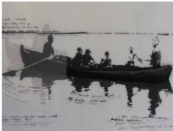
KUVA 5. Tutuilla teillä – taidetekstiili

Lisäksi olen valmistanut Tutuilla teillä - taidetekstiilin (kuva 5) sekatekniikalla, joka pääsi Utopia ja kotiinpaluu – Muotoilua tulevaisuuden kotiin, näyttelyyn Kuopion Muotoiluakatemialle. Näyttely oli Kuopion Rouvasväen yhdistyksen 150- vuotis juhlanäyttely, jonka ajankohta oli 20.5- 30.9.2010.