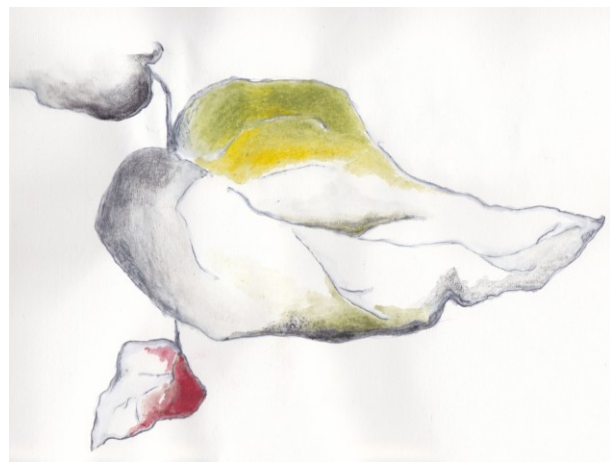
KUVA 20. Pieni oksa – luonnos