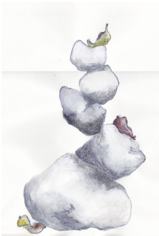
KUVA 15. Kivipino – luonnos 2