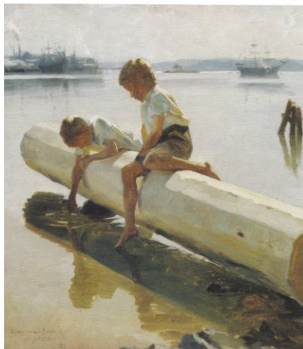
KUVA 2. Tukilla leikkivät pojat, toisinto, 1885. Öljy kankaalle, Albert Edelfelt