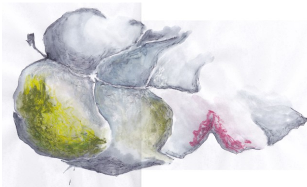
KUVA 19. Lehti - luonnos