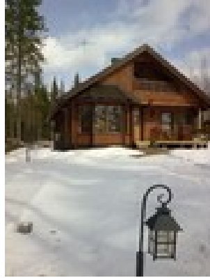
KUVA 9. Mökki mäntyjen ympäröimänä.