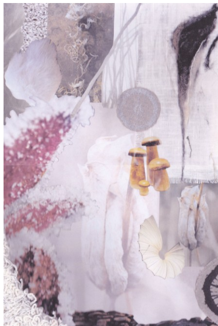
KUVA 8. Mielikuvakartta, Utu

Utu (kuva 8) on loppusyksyä, sateen tuomaa usvaa, kasvien kuolemista ja vaipumista talven horrokseen, kirpeitä ja pehmeitä sävyjä.