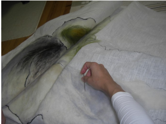
KUVA 38. Taidetekstiilin valmistaminen neulahuovutuksella