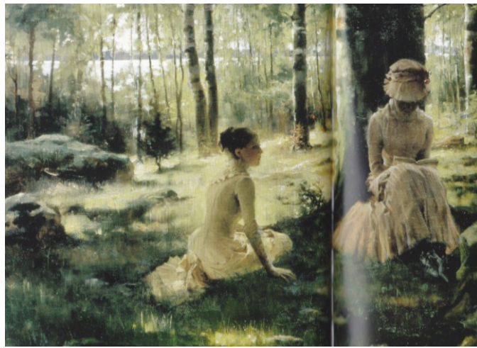
KUVA 1. Koivujen alla 2, 1882. Öljy kankaalle, Albert Edelfelt

Innoittajina omalle luomiselleni ovat lapsuuden ympäristö ja sen suoma luonnossa liikkuminen. Vieläkin luonnon lähellä liikkuessani teen jatkuvasti erilaisia havaintoja ympäristöstä, väreistä, äänistä, tuoksuista, säästä ja niin edelleen. Se on kuin osa minua. Taiteessa pidän yleisesti esittävästä ja maalauksellisista töistä, siitä tunnelmasta, mikä työstä välittyy katsojalle ja mikä jännite työssä on sen eri elementtien välillä. Ehkä tärkein on siitä välittyvä tunnelma ja sen paikalle asettuminen. Taiteilijoista pidän muun muassa Albert Edelfeltin (1854 – 1905) töistä. Esimerkiksi maalaus, Koivujen alla, vuodelta 1882 (kuva 1) tai Tukilla leikkivät pojat, toisinto, vuodelta 1885 (kuva 2) ovat mieleeni. Ateneumin taidemuseo, Valtion taidemuseo (2004, 98- 99, 123)