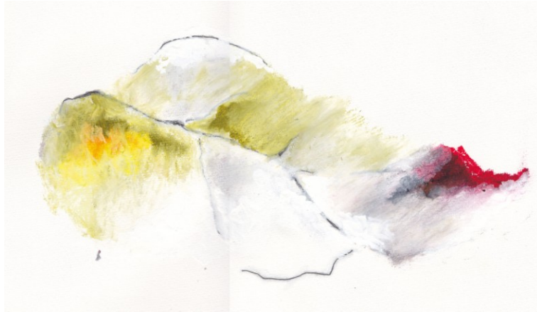
KUVA 29. Variaatio Haave – luonnoksesta