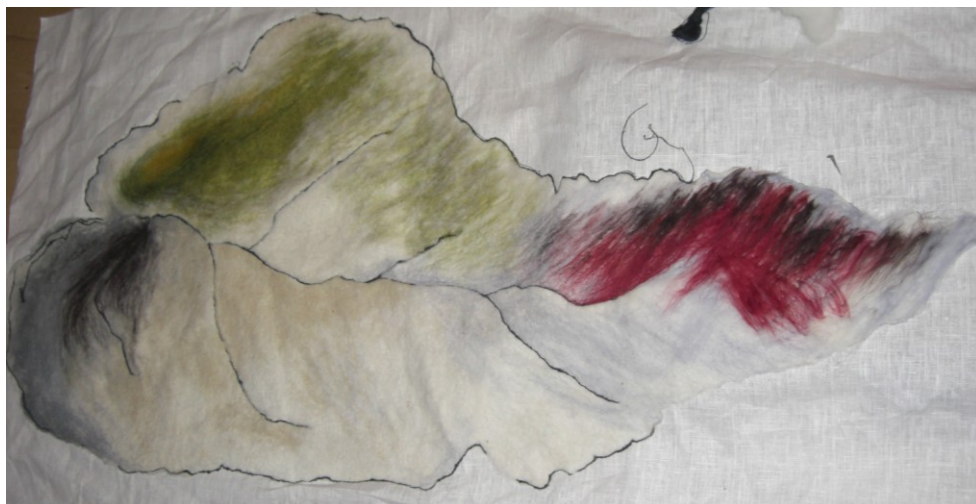
KUVA 39. Haave taidetekstiili ja villan värien yhdistyminen

Taidetekstiilin huovutusosuuden jälkeen työ sai lopullisen tarkan muotonsa viimeistelyä myöten. Näin tausta ei jäänyt rajoittamaan teoksen vapaata muotoa ja siitä tuli yhtenäinen, hieman kolmiulotteinen taidetekstiili. (kuva 40).