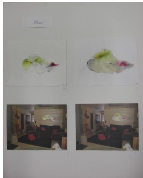
KUVA 34. Kuura ja Kuulas – esityskuvataulu KUVA 35. Haave – esityskuvataulu

Koska kaikki valitut luonnosvaihtoehdot olivat yksittäisiä ja asiakas oli kertonut pitävänsä kolmiulotteisesta ja vapaasta muodosta, sekä luonnonmukaisista materiaaleista kuten huovasta, päädyin neulahuovutuksen ja kirjonnin menetelmiin. Näillä keinoilla saisin parhaan mahdollisen lopputuloksen taidetekstiilistä. Huopa materiaalina soveltuu myös erinomaisesti vapaa-ajan asunnon sisustukseen. Se tuo mökin tunnelmaan lisää pehmeyttä ja lämpöä mutta myös valoisuutta väreillä valitsisipa asiakas minkä työn tahansa. Esityskuvatauluun lisäsin myös 1:1 materiaalikokeilun A 3 kokoisesta Kuura työstä (kuva 36) jossa käytin villaa ja pellavaa. Tilasin sopivat villa materiaalit ja niiden värit sekä ostin pellavakankaan taidetekstiiliä varten.