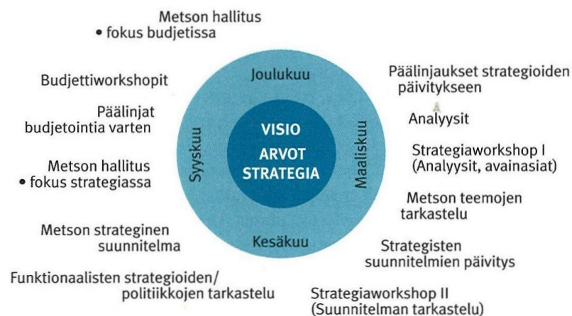
Kuvio 1. Metso Oyj:n vuosikello (Näsi & Aunola 2005, 128)

Näsi ja Aunola (2005, 128) esittävät kirjassaan Strategisen johtamisen teoria ja käytäntö Metso Oyj:n vuosikellon. Vuosikellon ytimessä ovat yrityksen visio, arvot ja strategia. Vuosikellossa joulukuun - kesäkuun aikana yrityksessä tapahtuvat päälinjaukset strategioiden päivityksessä, analyysit, strategiaworkshopit, yrityksen teemojen tarkastelu sekä strategisten suunnitelmien päivitys. Loppuvuosi koostuu funktionaalisten strategioiden tarkastelusta, strategisen suunnitelman teosta, hallituksen kokoontumisista, budjetoinnin päälinjojen luomisesta sekä niihin liittyvistä budjettiworkshopeista. Kuvion 1 kalenterimalli näyttää, että kevät- ja kesäpuoli ovat strategian aikaa. Syksy painottuu puolestaan budjetointiin.