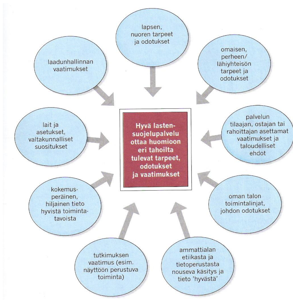
Kuva 1. Tahoja, joista kohdistuu vaatimuksia hyvälle lastensuojelupalvelulle (Rousu & Holma 2004, 11).

Kyetäkseen tuottamaan hyvää laatua, on sosiaali- ja terveydenhuollon organisaation selvitettävä ja huomioitava eri tahojen tarpeet sekä palveluille kohdistuvat vaatimukset ja odotukset. Huomioiminen tarkoittaa sitä, että esimerkiksi kasvatuskäytännöt, kuntoutusmenetelmät, asiakkaiden kohtelu ja työskentelytavat kehitetään sellaisiksi, että ne vastaavat asetettuihin vaatimuksiin. Myös organisaation arvojen tulisi heijastaa asiakaskunnan arvostamia asioita. (Rousu & Holma 2004, 10.)