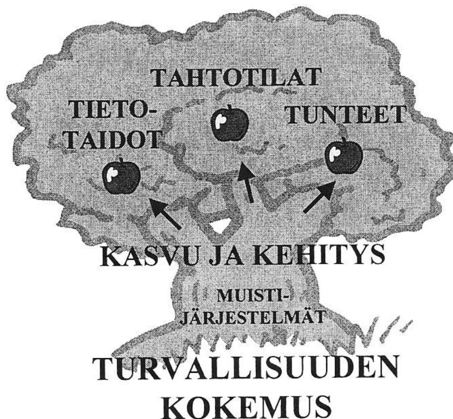
KUVIO 1. Turvallisuuden kokemuksen kokonaisvaltainen vaikutus lapsuuden ”elämänpuuhun” ja sen kypsyviin hedelmiin (Langinauer - Hakuni- Järvinen 2008).

riötilanteissa kohdistetaan jo olemassa oleviin ominaisuuksiin. Integritaatioteoria puolestaan lähtee ajatuksesta, että oireet helpottavat hoitamalla perusta kuntoon eli turvaistamalla ihminen (kuvio 1). Tämä on hänen mielestään integritaation ero aikaisempiin viitekehyksiin nähden. (Langinauer 2010.)