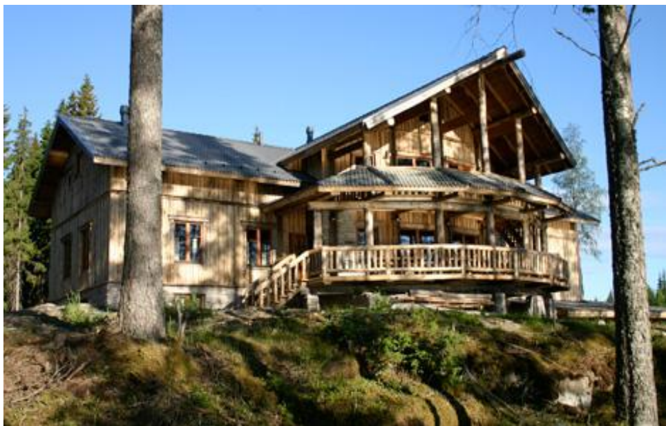
KUVA: Koivulahden Rapukartano ( www.rapukartano.fi )

Koivulahden Rapukartano on Suomessa harvinainen laatuaan. Kartano on rakennettu Pirkanmaalle kauniin Kuorevesi-järven rantaan. Talo henkii vahvasti suomalaisuutta ja se on ulkonäöltään jyrkevä ja suomalaisia perinteitä kunnioittava (kuva). Talo pitää sisällään tunnelmaltaan ja kooltaan erilaisia tiloja, jotka ovat ensiluokkaisia ja varustettu uusimmalla tekniikalla.