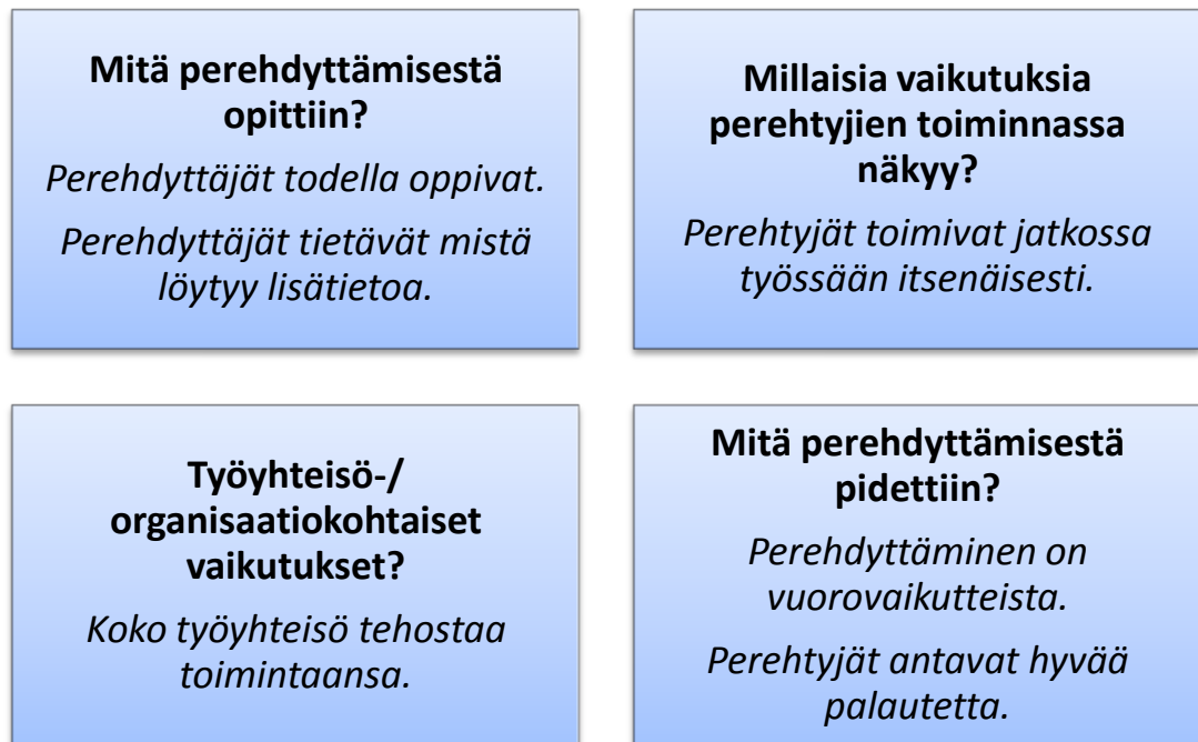
KUVIO 1. Hyvän perehdyttämisen tunnuspiirteitä (Kirkpatrick 1994, mukailen Kupias & Peltola 2009, 113, muokattu)

Perehdyttäminen suunnitellaan erilaisten perehdytettävien ja tarpeiden mukaan. Perehdytettäviä on monenlaisia ja niinpä perehdytys on sovellettava tilanteeseen sopivaksi. Työyhteisössä on lyhytaikaisia sijaisia, opiskelijoita työharjoitteluissa ja vakituisia työntekijöitä. Tämän vuoksi on tärkeää, että perehdyttäminen tapahtuu tehokkaasti, mutta kuitenkin mahdollisimman monipuolisesti. Perehdytyksessä voidaan kuitenkin käyttää perusrunkona samaa runkoa, jota sovelletaan jokaiseen tilanteeseen parhaaksi havaitulla tavalla. (Kangas & Hämäläinen 2007. 2-3.)