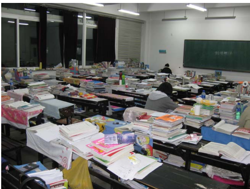
Kuva 3: Välituntivalokuva luokkahuoneesta kiinalaiselta yliopistolta