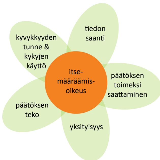
Kuva 1. Itsemääräämisoikeuden ulottuvuudet (Topo 2013).

Itsemääräämisoikeus on hyvin laaja käsite ja sitä pitää myös käsitellä moniulotteisesti. Dosentti Päivi Topo kuvaa itsemääräämisoikeutta kukkasella. Sen tarkoituksena on tuoda esiin, että jokaisen osa-alueen on toteuduttava, jotta itsemääräämisoikeus toteutuu. (Topo 2013.)