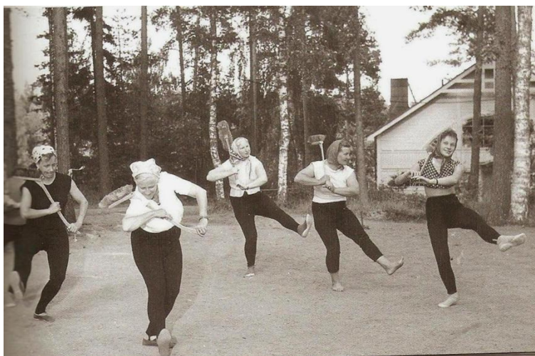
Kuvio 4: Naisvoimistelijoiden luutatanssijat Näsirinteen pihassa (Alajoki 2003)

Naisten Voimisteluopisto Säätiö avasi kurssikotinsa 21.6.1953. Alusta alkaen toimintaan kuului tyttöjen kesäleirit sekä voimistelun ohjaajien peruskurssit. Lisäksi huvilalla kävi lomailijoita sekä vierailijoita muista seuroista. (Alajoki 2003, 34, 38.)