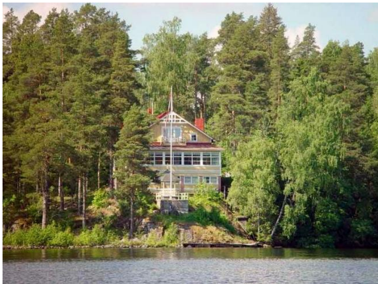
Kuvio 5: Villa Näsirinne 2000-luvulla (Tiina Mäkelä)

Huvilan tiloihin mahtuu ruokavieraita 150 henkeen asti ja tanssitaloon toiset 150 henkeä . Alueen mökeissä ja makuuhuoneissa mahtuu yöpymään noin 20 henkeä . Näsirinteessä on äänentoistolaitteet, videotykki ja valkokankaat sekä huvilassa että tanssitalossa. Nämä lähtökohdat luovat puitteet hyvin erilaisille tapahtumille.