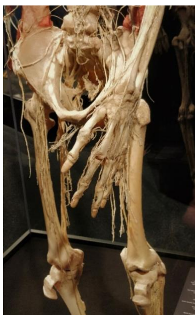
Kuva 3. Kehon hermosto

Body Worlds -näyttely esittelee ruumiita ja on siten suoraan liitettävissä kuolemaan. Ruumiit tuodaan esille esteettisesti, mutta samalla ajatus ruumiista, joka on plastinoitu, muotoiltu neuloilla tai mahdollisesti leikattu siivuksi, tuntuu todella pahalta. Vaikka ruumiit on lahjoitettu näyttelyn käyttöön, niiden esittämisessä on jotain vastenmielistä.