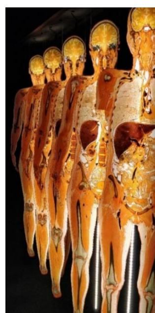
Kuva 5. Siivutettu Ruumis