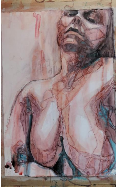
Kuva 14. Hahmo 3 (Kähkönen 2019.)