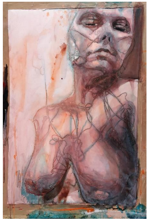
Kuva 10. Prosessikuva 3 (Kähönen 2019.) Kuva 11. Hahmo 2 (Kähönen 2019.)

Kun lanka on poistettu (Kuva 10), alan maalaamaan hahmon pintaa maalaustelineellä yrittäen luoda kolmiulotteista muotoa. Käsittelen hahmoa tasoina, värimuutos tarkoittaa tason kääntymistä. Kolmiulotteisuus syntyy, kun kasvojen tai kehon valo- ja varjokohdat asettuvat paikoilleen tavalla, joka saa jotkin kohdat nousemaan katsojaa kohti ja toiset painumaan pois päin.