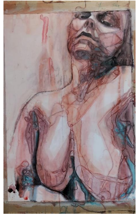
Kuva 13. Hahmo 3 (Kähkönen 2019.)

Olen kiinnittänyt omissa teoksissani paljon huomiota hahmojen muotoon ja niiden pintaan tai ihoon. Tavoitteenani on yhdistää ruumiillisuutta henkilöahmon olemukseen tekemällä ihosta läpikuultavan ja paljastamalla suoniston sen alla. Kuvassa 12 langan avulla tehty suonisto hehkuu ihon alta ja tuo hahmoon brutaaliutta. Hahmon verisuonet kuultavat ihon läpi kirkkaan sinisinä. Siitä syntyy tietynlaista veteen upotetun ruumiin tuntua, se antaa katsojalle ajatuksen läpinäkyvästä lihasta.