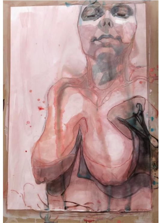
Kuva 15. Hahmo 1 (Kähkönen 2019.)

Olen pyrkinyt yhtenäiseen värikköön värikokonaisuuteen, jossa värit työskentelevät yhdessä luoden kauniin ja harmonisen kokonaisuuden. Teoksessa on herkkää, ohutta ja siroa värikköä, siinä olevat puhtaat sävyt nousevat herkästi esille vaaleiden pastellisävyyden kautta (Kuva 15).