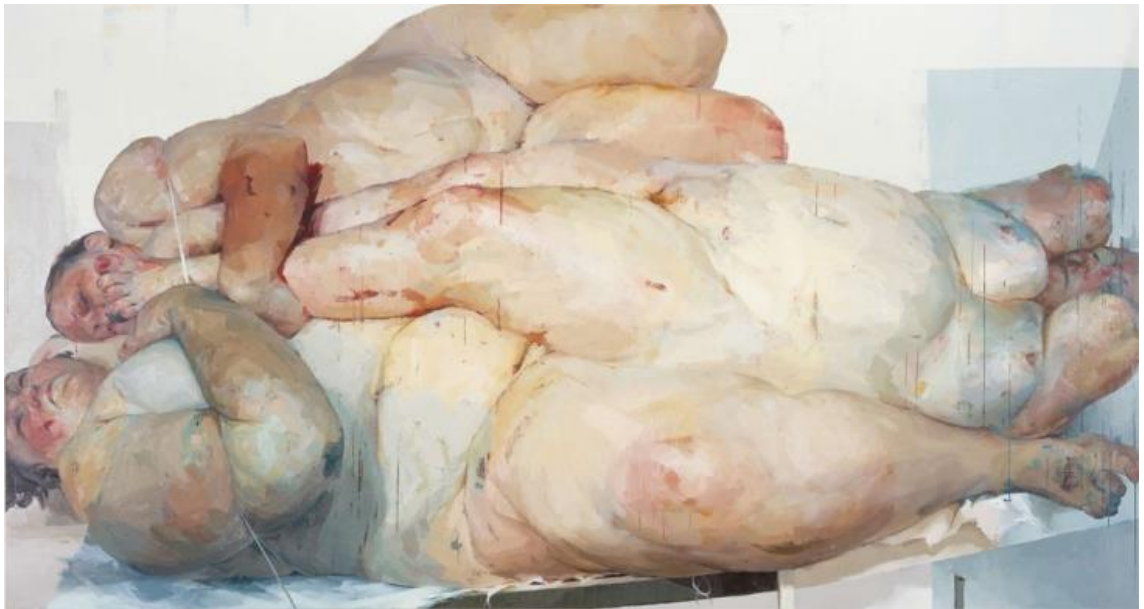
Kuva 1. Fulcrum Jenny Saville 1998–1999 (Saatchi Gallery) a

Ensimmäisenä teoksena tuon esiin Fulcrum (Kuva 1), joka on Jenny Savillen vuosina 1998–99 maalaama teos. Teos kuvaa kolmea lihavaa naista, jotka on asetettu makaamaan päällekkäin. Hahmot on sidottu yhteen narulla, joka on kiristetty kaikkien naisten ympärille. Naiset pitävät toisistaan kiinni lujaa, he ovat kuin kietoutuneet yhdeksi massiiviseksi lihavuoreksi, ja raajoista ei ole enää varma, mikä kuuluu kenelle.