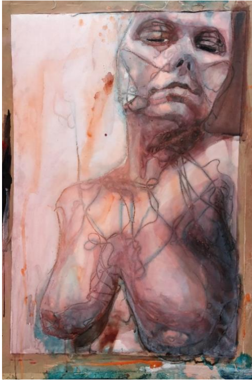
Kuva 12. Hahmo 2 (Kähkönen 2019.)