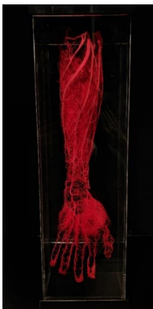
Kuva 4. Verisuonisto