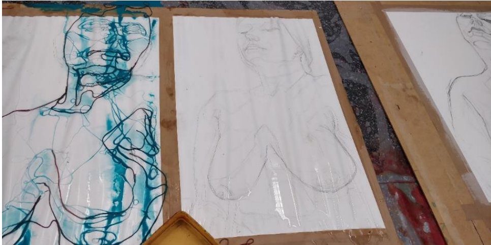
Kuva 8. Prosessikuva (Kähönen 2019)

Ensimmäinen langan ja värin muodostama kerros voi olla monokromaattinen tai siinä voi yhdistyä eri värejä. Olen tehnyt ensimmäisen kerroksen puhtaan siniseksi vasemmanpuoleiseen rintakuvaan (Kuva 8). Sen kuivuttua olen kastellut paperin ja asettanut lämpimän sävyn sinisen päälle (Kuva 9, vasen hahmo). Oikeanpuoleiseen rintakuvaan laitoin samaan aikaan kahta eri sävyä, sinistä sekä vaalean kellertävää.