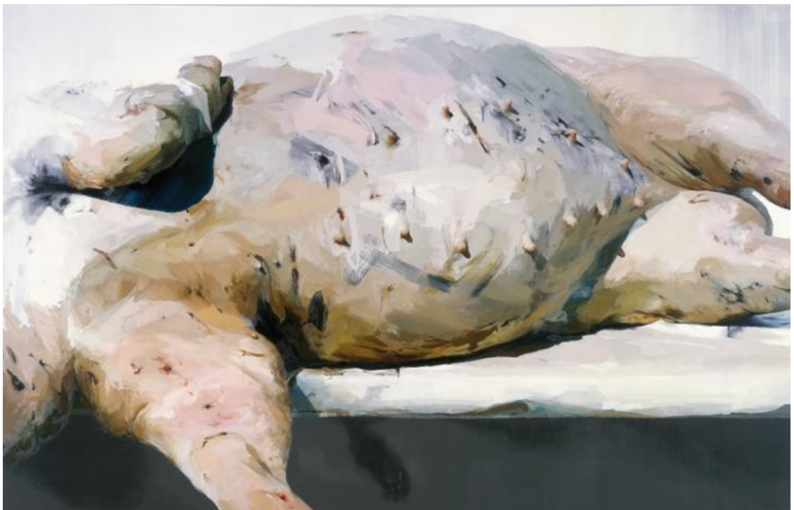
Kuva 2. Host Jenny Saville 2000 (Saatchi Gallery) b

Nostan esiin myös toisen esimerkin Jenny Savillen tuotannosta, vuonna 2000 maalatun teoksen Host (Kuva 2). Host on öljyvärimaalaus, joka kuvaa vaaka-asennossa makaavaa sian torsoa. Sian pää on leikattu pois kuvarajauksella, eivätkä sen jalat ole kokonaan näkyvissä. Teoksen tilanne on katsojalle epäselvä. Sian pinta on kaunista, ja siinä on eloisa hehku, mutta sian asento pöydällä ja sen ylimenevät raajat ja pää viittaavat kuolemaan. Torsoon on sekoitettu ihmisen ja eläimen piirteitä: se on eläimen torso, mutta teoksen olemus ja sen värimaailma on ihmisen ihoon sopiva. Tämä luo käsityksen ennemminkin ihosta kuin sian nahasta. Teos aiheuttaa katsojassa vastenmielisyyden tunteita, sillä ihmistä ei halua nähdä eläimen asemassa tai sen paikalla.