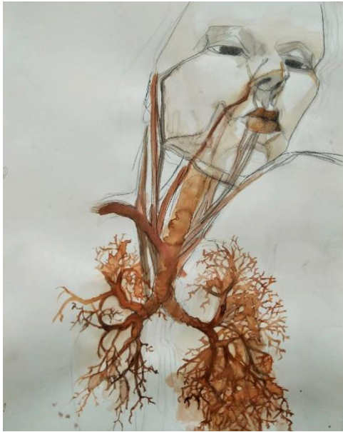
Kuva 6. Pusi pusi (Kähönen 2018)

Toisessa luonnoksessa (Kuva 7) on nostettu esiin kaulan lihaksia, keuhkoputkea sekä keuhkojen poimuja ihon pinnan pysyessä kuitenkin ehjänä. Yrityksenä oli luoda päällekkäisiä pintoja sekä keuhkoja kehon sisältä että ihoa sen päältä.