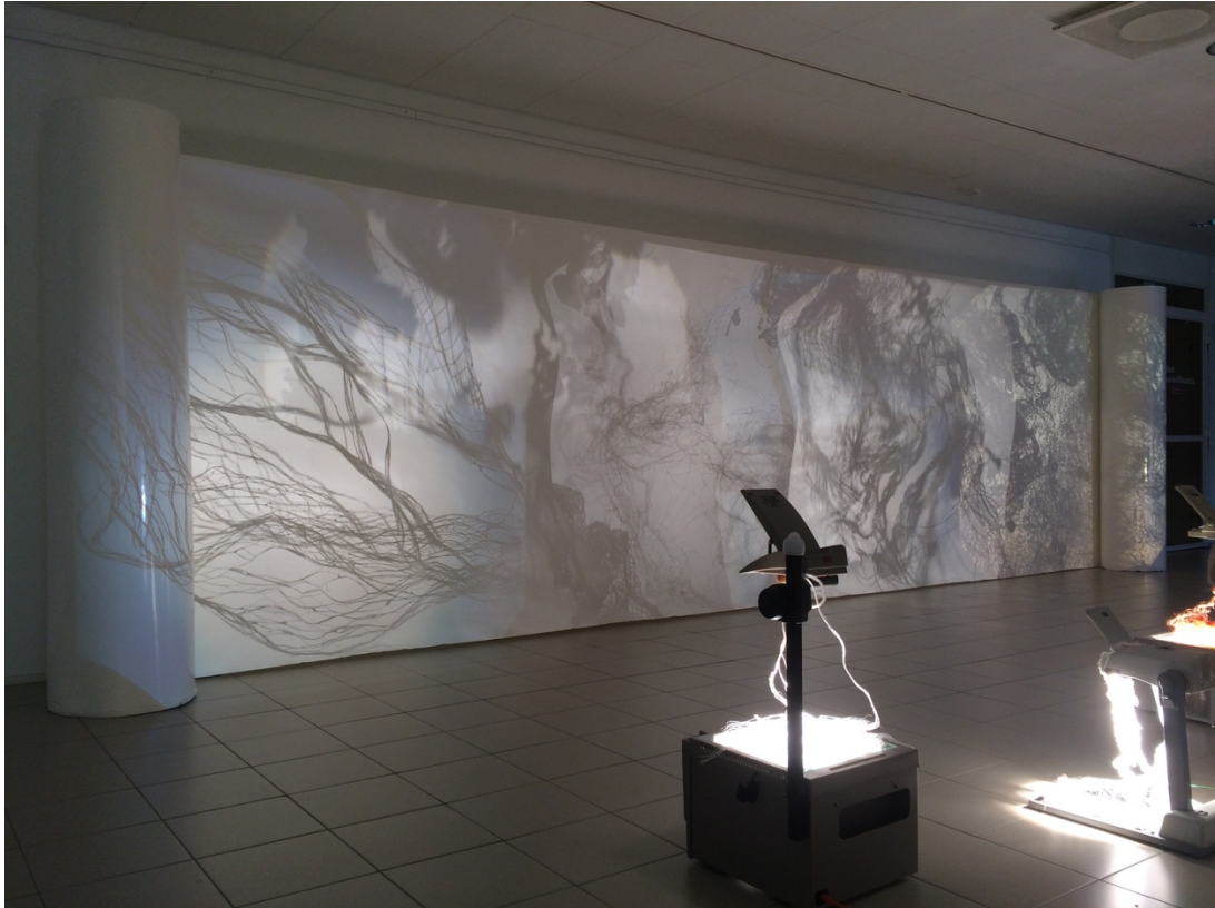
Kuva 2. Installaatio vasemmalta katsottuna (Raatikainen 2019)