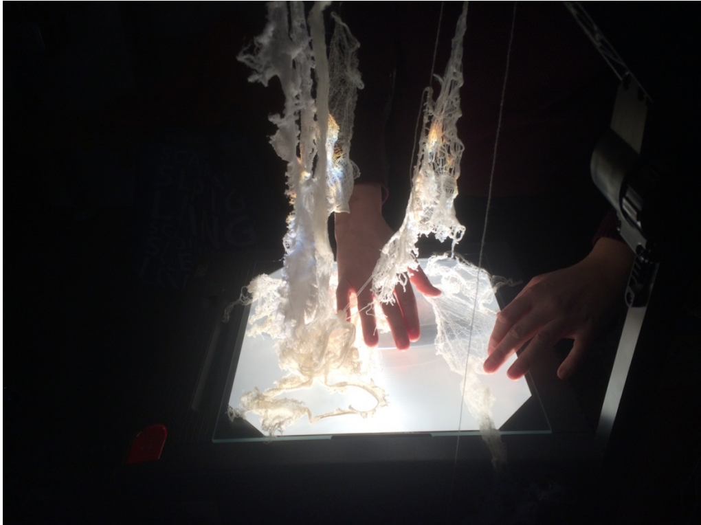
Kuva 5. Purettua neulosta (Pitkänen 2019)