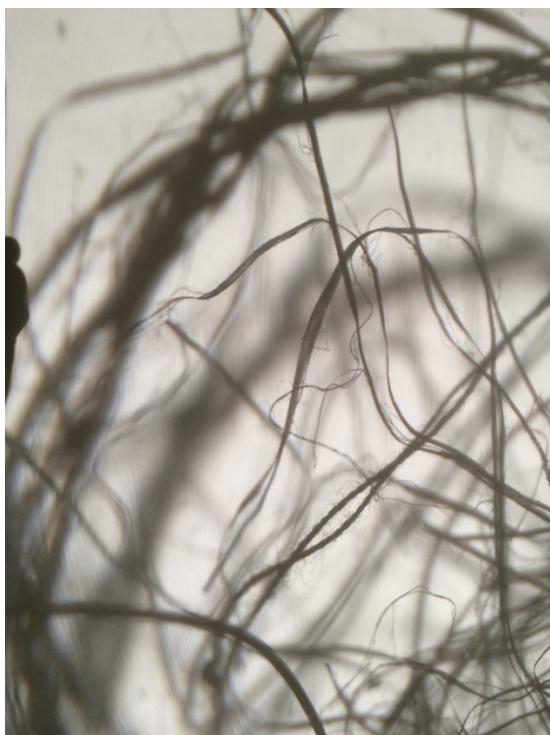
Kuva 7. Tarkkaa ja epätarkkaa (Raatikainen 2019)

Pyrkimällä luomaan varjoista kauniita ja mystisiä haluan tuoda teokseeni metsien henkistä ulottuvuutta. Kauneuden ja pyhyiden läsnäolon kokemukset voivat tuoda voimaa, iloa ja tunteen elämän merkityksellisyydestä. Niitä voi kohdata metsän keskellä. Vaikka installaationi ei pyri olemaan kokonainen metsä, jotain metsän parhaimmillaan tuomasta elämyksellisyydestä toivon välittyvän katsojalle.