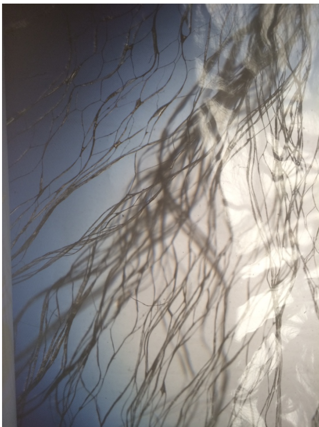
Kuva 6. Rihmastokuvioita (Raatikainen 2019)