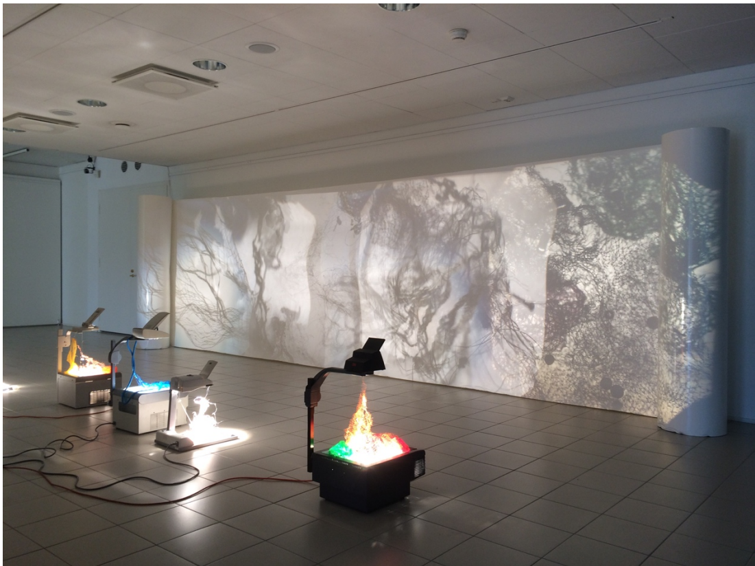
Kuva 3. Installaatio oikealta katsottuna (Raatikainen 2019)