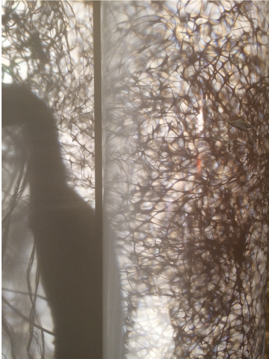
Kuva 8. Katsojan varjo (Raatikainen 2019)