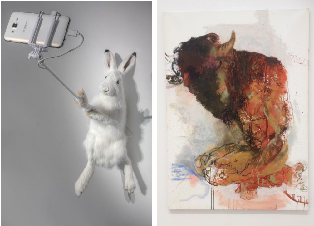
Kuva 2. Pekka Jylhä, And They Took Selfies as They Ate Carrots , Täytetty jänis, teräs, älypuhelin, selfiekeppi, 89 cm x 40 cm x 55 cm, 2016 (Pekkajylhä)