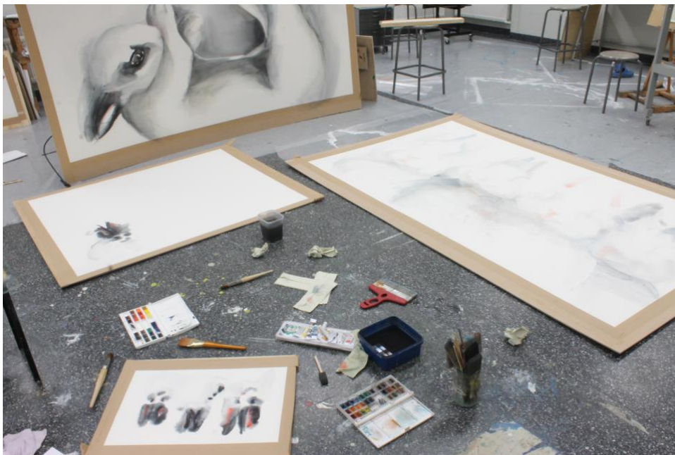
Kuva 4. Työskentelyä monen työn kanssa (Reinikainen 2019)

Työskentelytapani kuuluu työstää monta teosta samaan aikaan (Kuva 4). Tällä tavalla vältän teosten yli työstämistä. Aloitan työskentelyni tarkastelemalla, mitä työ tarvitsee. Maalaan työtä niin kauan, kunnes totean, että työn pitää antaa kuivua ja siirryn seuraavaan työhön. Päätös syntyy joko omasta toteamuksesta, työhön ei voi enää lisätä maalia, tai paperi on nukkaantunut liikaa. Usein työskentely loppuu turhaantumiseen virhesivellinvetojen tai roiskeiden takia. Turhaantuneisuudella saan työskentelyyni rennomman otteen. Tehdessäni virheitä ajattelen, että työ on epäonnistunut, eikä se voi enää huonommaksi muuttua. Töiden kuivuttua tarkastelen, mitä olen tehnyt, miltä ne näyttävät ja mitä ne vielä tarvitsevat.