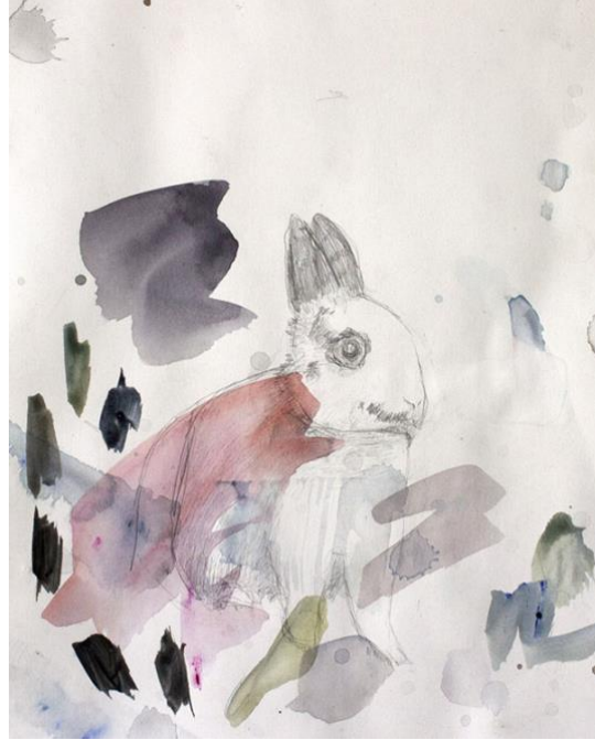
Kuva 5. Valokuvan pohjalta tehty luonnos, lyijytäkynä ja akvarelli paperille, 30 cm x 21 cm, 2019 (Reinikainen 2019)