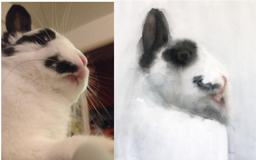
Kuva 10. Valokuva ja siitä toteutettu luonnos, akvarelli paperille, 36 cm x 32 cm, 2019 (Reinikainen 2019)

Teoksissani kuvaan kanit arkipäiväisissä toimissaan, eivätkä ne tietenkään ymmärrä niiden toimien välittävän jotain ihmismäisiä piirteitä tai tunteita.