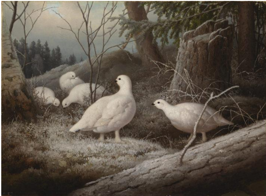
Kuva 1. Ferdinand von Wright, Riekkokko, öljyväri kankaalle, 1893 (Pakarinen)

186) kertoo, että tunnetuimpiin 1800-lopun suomalaisiin eläinmaalareihin kuuluu lintumaalarit von Wrightin veljekset, joista tunnetumpi lienee Ferdinand von Wright. Heidän maalaamansa yksityiskohtaisesti maalatut linnut ovat lajitunnistettavissa ja esteettinen arvo on niissä itsessään (Kuva 1). Tieteellisesti tutkituissa linnuissa ilmenee lajiominaista käyttäytymistä luonnollisessa ympäristössä. (Remes 2009, 185 - 186.)