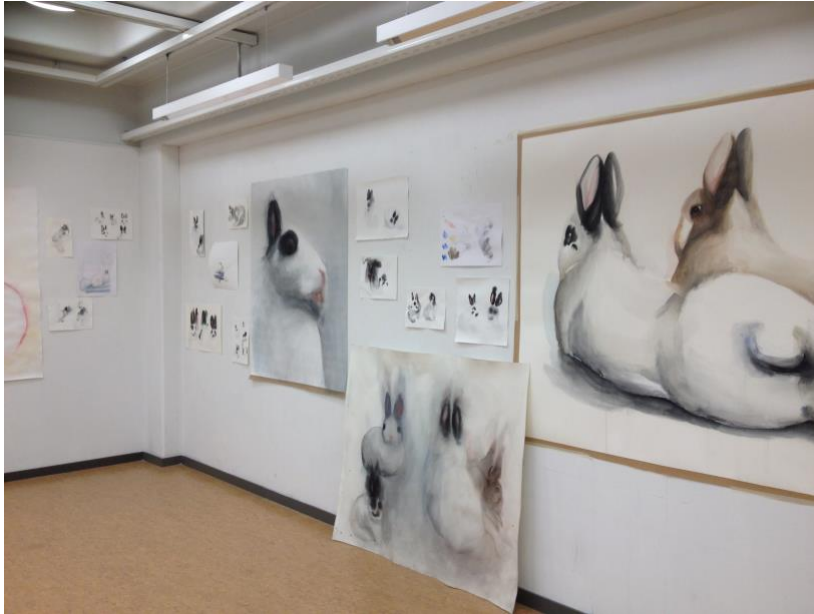
Kuva 7. Ensimmäinen ripustus kokeilu (Reinikainen 2019)