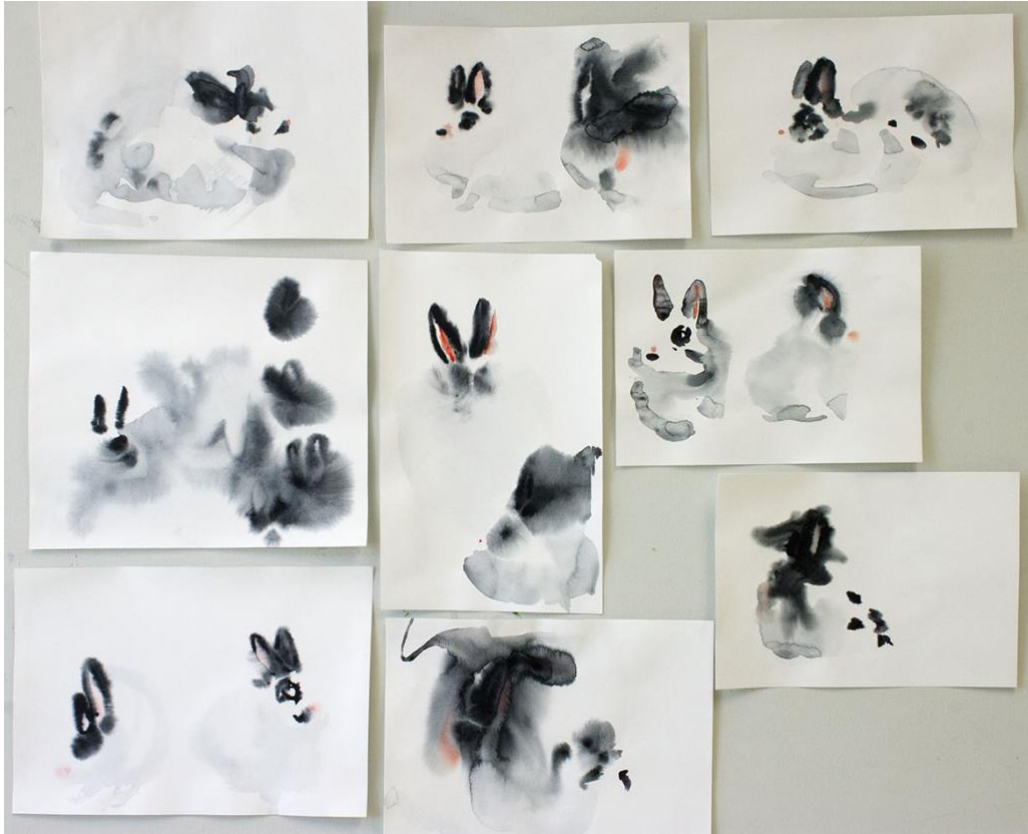
Kuva 6. Croquis maalauksia, akvarelli paperille, koot noin 30 cm x 21 cm, 2019 (Reinikainen 2019)