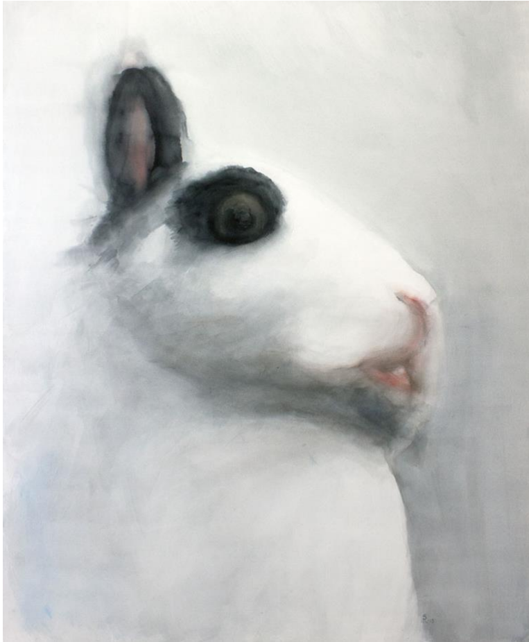
Kuva 9. Akvarelli paperille, 130 cm x 108 cm, 2019 (Reinikainen 2019)