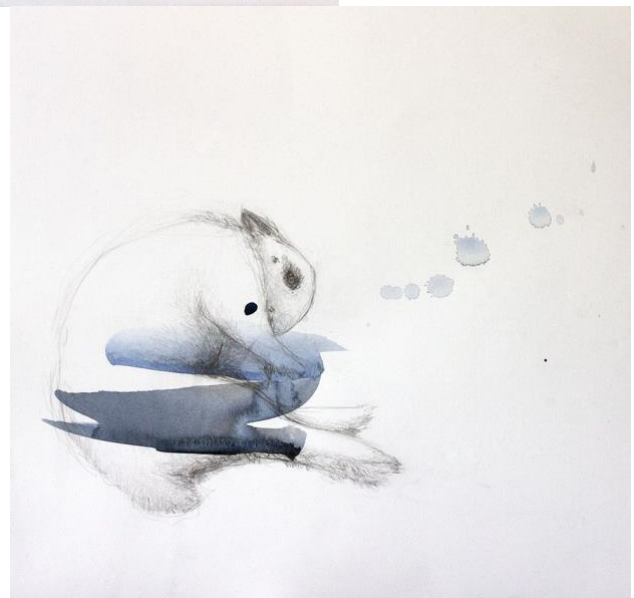
Kuva 11. Teos tekovaiheessa, sekä lähtökohta valokuva ja luonnos, akvarelli ja lyijytäkynä paperille, luonnos 30 cm x 30 cm, teos 133 cm x 108 cm, 2019 (Reinikainen 2019)