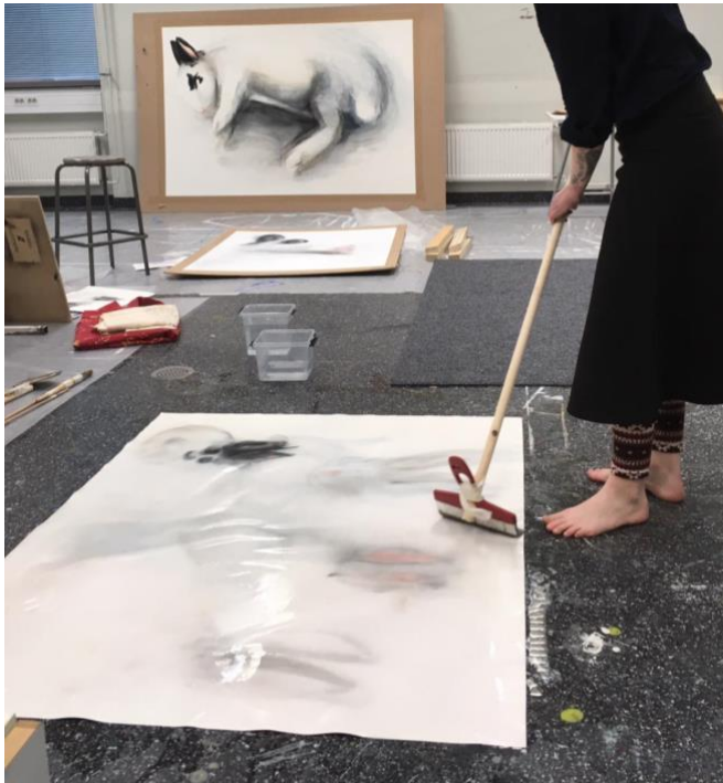
Kuva 8. Märän paperin työstämistä keppiin sidotulla isolla pensselillä (Inkala 2019)

Opinnäytetyön ohjaava taiteilija kertoi märkäpaperitekniikasta. Paperi kastellaan läpimäräksi altaassa ja laitetaan lattiaa vasten (Kuva 8). Paperi käytännössä ui vedessä, jolloin maalia oli helppo liikuttaa, jättämättä paperiin jälkiä. Ohjaava taiteilija mainitsi töitteni kanien olevan jäykkiä, niin sanottuja desing-kaneja, joissa ei näy elävän kanin olemusta. Samoin töiden taustat jäivät turhan tyhjiksi, ettei niissä ollut minkäänlaista tilan tuntua. Hän arveli, että märässä paperissa maalin liikkuvuus voisi auttaa viitteellisen tilan luomisessa ja kanin eloistamisessa.