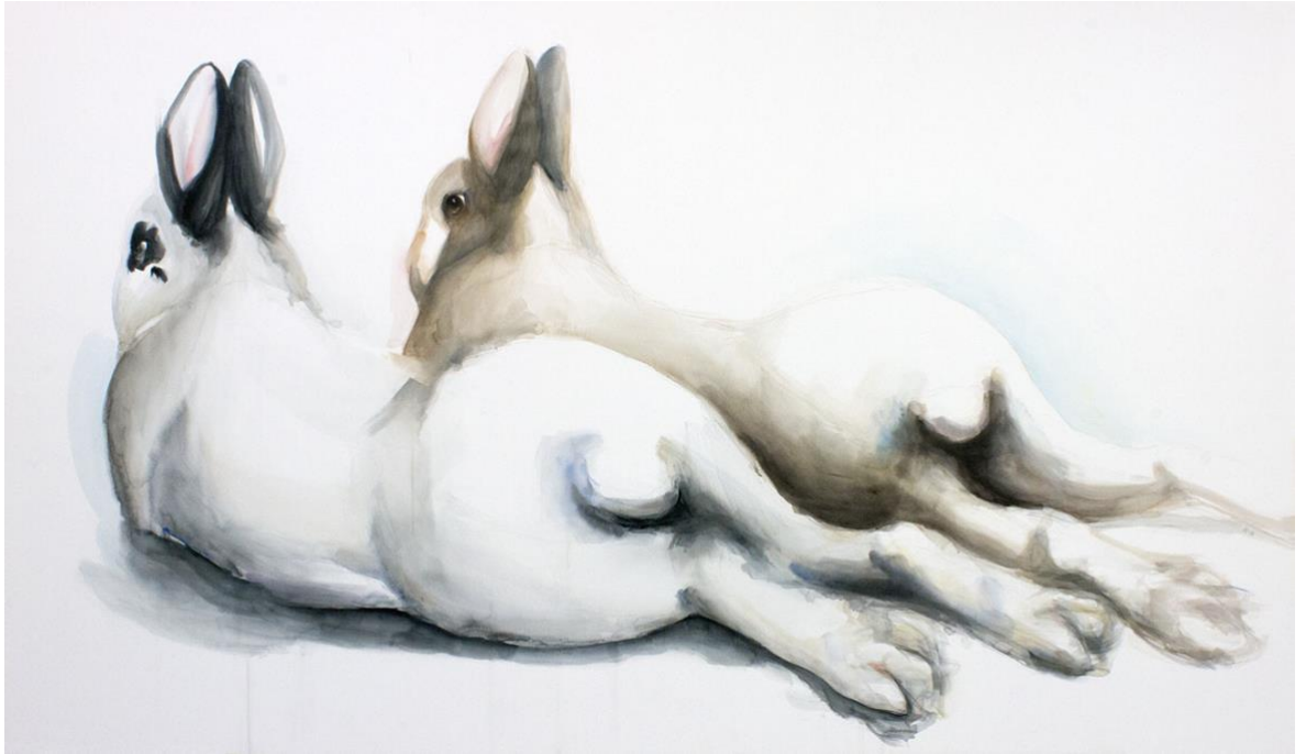
Kuva 13. Valmis teos, akvarelli, 134 cm x 231 cm, 2019 (Reinikainen 2019)

Viimeisimmässä työssäni kuvaan kuutta kania (Kuva 14). Poikkeuksena tässä työssä on, etten käyttänyt kanini mallikuvia apuna luonnosteluvaiheessa. Piirsin luonnostelukirjaani luonnoksen, jonka päätin toteuttaa isommassa koossa (Kuva 15). Huomasin suuressa osassa teoksistani näkyvän vain yhden kanin. Halusin tehdä teoksen, jossa niitä on enemmän, jotta teoskokonaisuus olisi monipuolisempi. Teosta tehdessäni sain ymmärryksen, miten minun kannattaa maalata akvarelleilla. Minun ei kannata aluksi maalata kania, vaan taustaa sen ympäriltä. Tällä tavalla kani muuttuu eloisammaksi, sillä en rajaa kanin muotoja sivellinvedoilla. Rajaan sen taustalla tai tässä tapauksessa usein toisella kanilla. Loppuviimeistelyksi tein muutamalle kanille turkin tuntua. Käytin sitä varten kuivaa kuivalle akvarellitekniikkaa, eli melko kuivaa maalia kuivalle paperille.