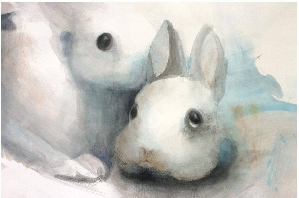
Kuva 14. Viimeisin työ sekä yksityiskohta, akvarelli ja lyijytäytetynä paperille, 134 cm x 230 cm, 2019 (Reinikainen 2019)