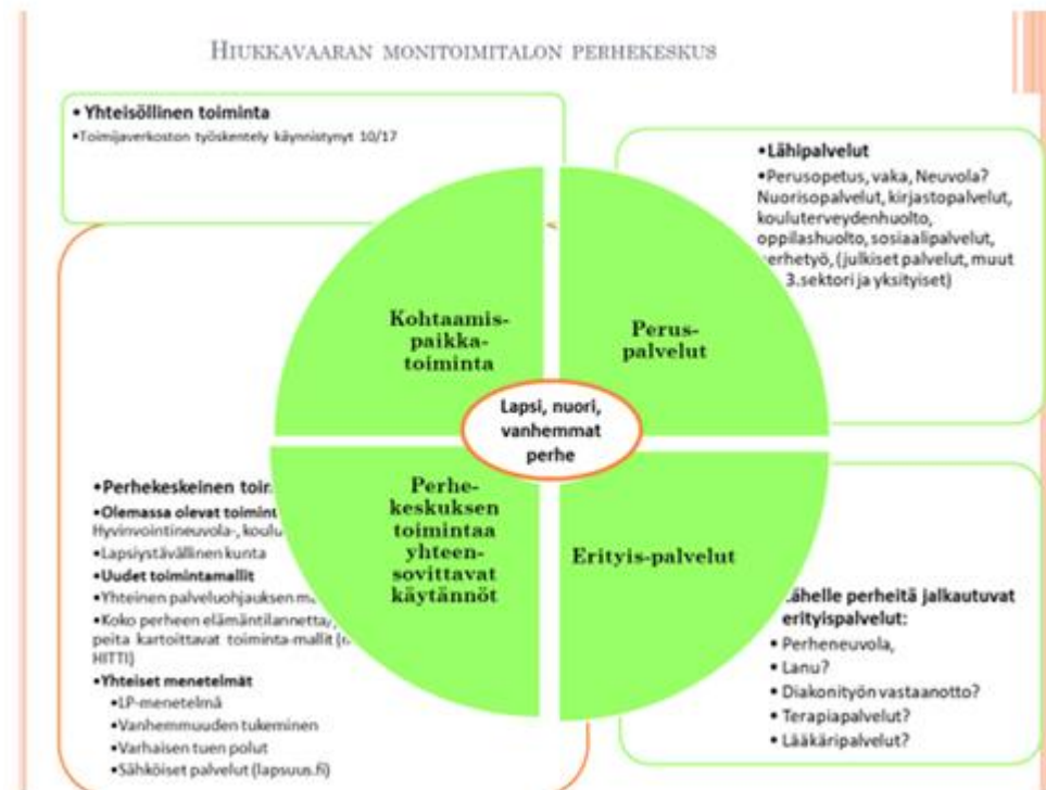
Kuvio 3. Perhekeskus-malli. Martikainen Airi. 2018. (Putila 2019, 13)

Nyt olemassa olevat tilat eivät vahvista perhekeskusta, jos ajatellaan perhekeskuksen toimivan saman rakennuksen alla. Muille toimijoille olisi hyvä rakentaa lisätiloja. Perhekeskuksen muodostamiseen kuuluu moniammatillisen työn takaaminen eri sektoreiden välillä. Tällöin eri ammattiryhmien on tiedettävä, mitä muut tekevät. Kaikilla on myös oltava yhtenäinen käsitys yhteistyöstä ja sen muodoista.