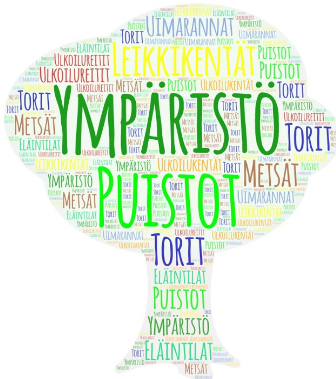
Kuvio 4: Ympäristön tarjoamia palveluita lapsiperheille Nurmijärvellä.

Nurmijärvellä jo ympäristö itsessään tarjoaa paljon tekemistä lapsiperheille (kuvio 4). Torit, puistot ja metsät tarjoavat paikkoja retkeilylle ja vapaa-ajan vietoille. Nurmijärvellä löytyy paljon leikkikenttiä asuinalueiden läheisyydestä. Näiden lisäksi koulujen ja päiväkotien pihoja löytyy laajalti eri alueilta. Nurmijärven kunnan nettisivuilta löytyy karttoja sekä leikkikenttien sijainneista että erilaisista ulkoilureiteistä, joista perhe voi valita itselleen sopivimman. Lisäksi nettisivuilla on lueteltu paljon erilaisia liikuntamahdollisuuksia lapsiperheille, esimerkiksi uimarannat, suunnistusreitit ja ulkoilukentät. Nurmijärvellä löytyy myös muutama eläintila, esimerkiksi Klaukkalasta Ali-Ollin Alpakkatila, joka nauttii lapsiperheiden suosiota. (Nurmijärvi n.d.d; Nurmijärvi n.d.e).