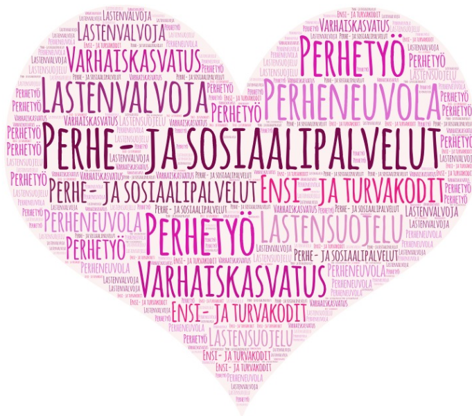
Kuvio 2: Perhe- ja sosiaalipalvelut lapsiperheille Nurmijärvellä.

Nurmijärvellä perheneuvola, lastensuojelu, perhetyö, ensi- ja turvakodit, lastenvalvoja sekä isona osana varhaiskasvatus kuuluvat näihin perhe- ja sosiaalipalveluihin (kuvio 2). Nämä kaikki mainitut tahot tarjoavat eri tasoilla apua perheille arjen haasteissa ja pulmissa. (Nurmijärvi n.d.c.)