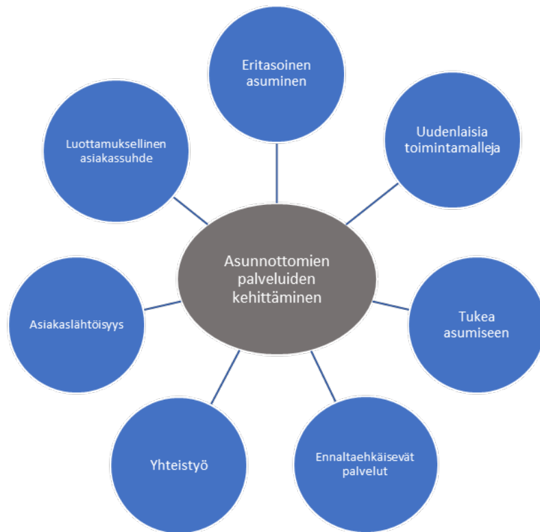
Kuva 2. Asunnottomien palveluiden kehittäminen

Tutkimustulosten mukaan hyödyllisiä palveluita asunnottomille ja asunnottomuuden vähentämisessä olivat välitystili, aikuissosiaalityön matalan kynnyksen neuvonta, ympärivuorokautinen mielenterveys- ja päihdepäivystys sekä liikkuvuus toiminta. Haastatteluissa nousi esille, että Lappeenrannassa asunnottomille on tarjolla tällä hetkellä edellä mainittujen palveluiden lisäksi tilapäismajoitus ja tukiasunnot. Haastatteluissa tuli ilmi, että tukiasunnoille olisi enemmän tarvetta, samoin kuin eritasoiselle asumiselle. Tutkimustuloksissa nousee esille, että aikaisemmin asunnottomana olleet sekä asunnottomuusuhan alla olevat tarvitsisivat enemmän tukea asumiseen Lappeenrannassa. Tätä voitaisiin haastateltavien mukaan toteuttaa jalkautuvan työn, asumissosiaalityön tai asumisneuvonnan avulla.