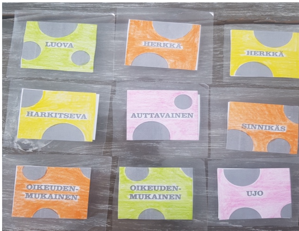
Kuva 2: Vahvuuskortit (Mieli. Julisteet ja kortit. Vahvuuskortit).

Toisena tehtävänä oppitunnilla oli valita yksi tai useampi vahvuuskortti, joka kuvaava luokan vahvuuksia. Oppilaat kiertelivät luokassa ja valinnan jälkeen oppilaat istuutuivat alas ja vuorotellen jokainen sai tulla luokan eteen ja kertoa, mikä tai mitkä vahvuuskortit oli valinnut kuvaamaan luokan vahvuuksia. Toinen ohjaajista keräsi kaikki vahvuuskortit järjestykseen lattialle ja oppilaiden valitsemista luokan vahvuuksia kuvaavista vahvuuskorteista ikuistettiin kuva. Vahvuuskortteja jätettiin luokalle käytettäväksi tulevaisuuteen opettajien harkinnan mukaan.