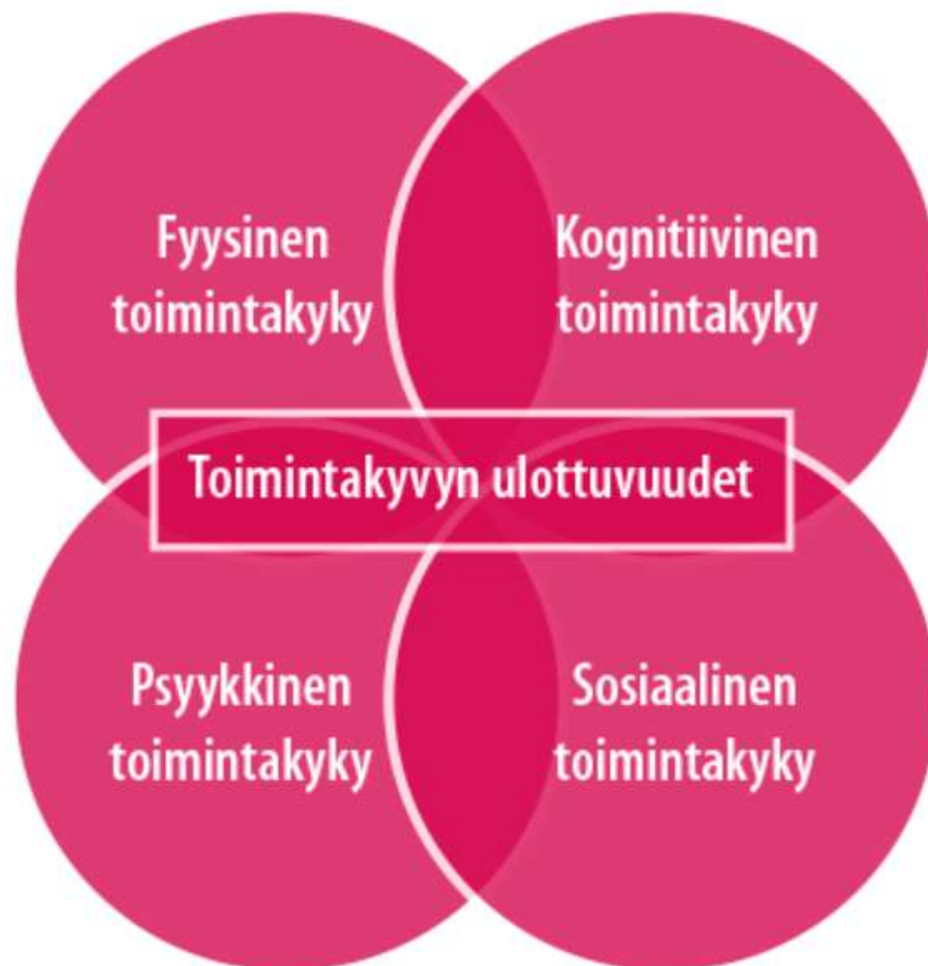
Kuvio 2 Toimintakyvyn ulottuvuudet (Sosped, 2019)

Sosiaalinen toimintakyky on yksi ihmisen toimintakyvyn ulottuvuus. Se liittyy muihin ulottuvuuksiin limittäin, ja ulottuvuudet ovat keskenään päällekkäisiä.