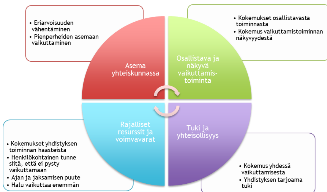
Kuvio 1: Aineiston ala- ja yläluokat

Tässä opinnäytetyössä noudatettiin aineistolähtöisen sisällönanalyysin mallia. Aineistolähtöisyyden takia ei voitu ennen analysoinnin suorittamista tietää, millaisia tai minkä tasoisia luokkia aineistosta syntyy, vai syntyykö niitä ollenkaan. Jokainen aineisto on nimittäin ainutlaatuinen. (Tuomi & Sarajärvi 2018, 12.) Tässä opinnäytetyön sisällönanalyysissä syntyi alaluokkien lisäksi yläluokat, vaikka jossain kohtaa analysointia teemoittelu näyttäytyikin todennäköisempänä vaihtoehtona. Aineistosta syntyi neljä yläluokkaa ja kymmenen alaluokkaa.