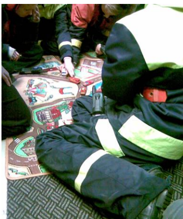
Kuva: Virve- radioharjoitus

Kuvassa kouluttaja opastaa Virve-radion (viranomaisten: poliisi, pelastuslaitos jne. tietoliikenneverkosto) käyttöä. Lattialla on lasten matto, jossa on esitetty tiet ja rakennukset. Esillä on kuviteltu onnettomuustilanne, jossa jokaisella nuorella on jokin tilanteeseen vaadittu rooli: hätäkeskuspäivystäjä, sairaankuljettaja jne. Tehtävänä on kommunikoida Virve-radion avulla siten, että onnettomuuskohteeseen saadaan apua paikalle.