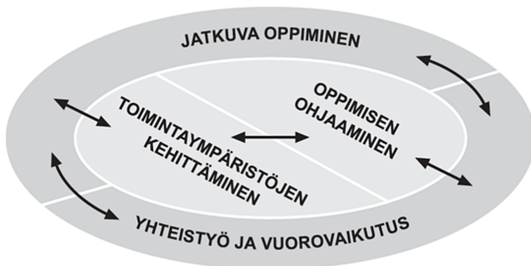
Kuva: Kokonaisvaltainen toimintaympäristön kehittäminen

Monitahoisen yhteistyön (mt., 151) periaatteisiin kuuluvat lasten- ja nuorten vaikeuksien ennaltaehkäiseminen sekä varhainen puuttuminen, yhteistyön tekeminen lasten vanhempien ja muiden ammattilaisten kanssa sekä luottamuksellisuus ja salassapitosäädökset.