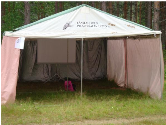
Kuva: Telttakatos luennot 1. ja 3.

Seuraava kuva luennoltani toimi johdattajana diagnosoituihin oppimisen vaikeuksiin keskiviikkona 7.7.2010. Halusin laittaa sen tähän muistuttamaan aiheesta, minkä koen yhdeksi tärkeäksi osaksi opinnäytetyötäni.