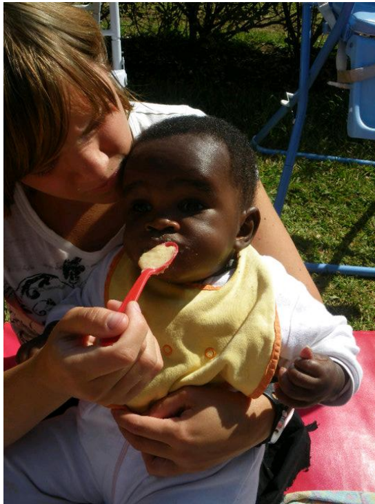
Kuva 1 Vapaaehtoistyöntekijä syöttämässä vauvaa Lilongwen Crisist nursessää

jän maksettavaksi tulee, lennot Etelä-Afrikkaan, matkavakuutus ja mahdollinen viisumi.