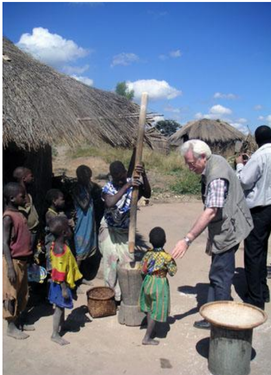
Kuva 2 Malawi Lake Basin Programmen työntekijä kylävierailulla

Puhuttaessa Malawista monelle tulee ensimmäiseksi mieleen mediassa olleet kertomukset Madonnan Malawin matkoista ja hänen lastensa adoptointi Malawista. Tähän tietämyksemme Malawista usein sitten rajoittuukin. Malawi on yksi Afrikan köyhimmistä maista. Ei ole siis sattumaa, että maassa on lukuisia humanitaarisia organisaatioita, jotka pyrkivät auttamaan paikallisia ihmisiä ja tukemaan Malawia sen kehityksessä.