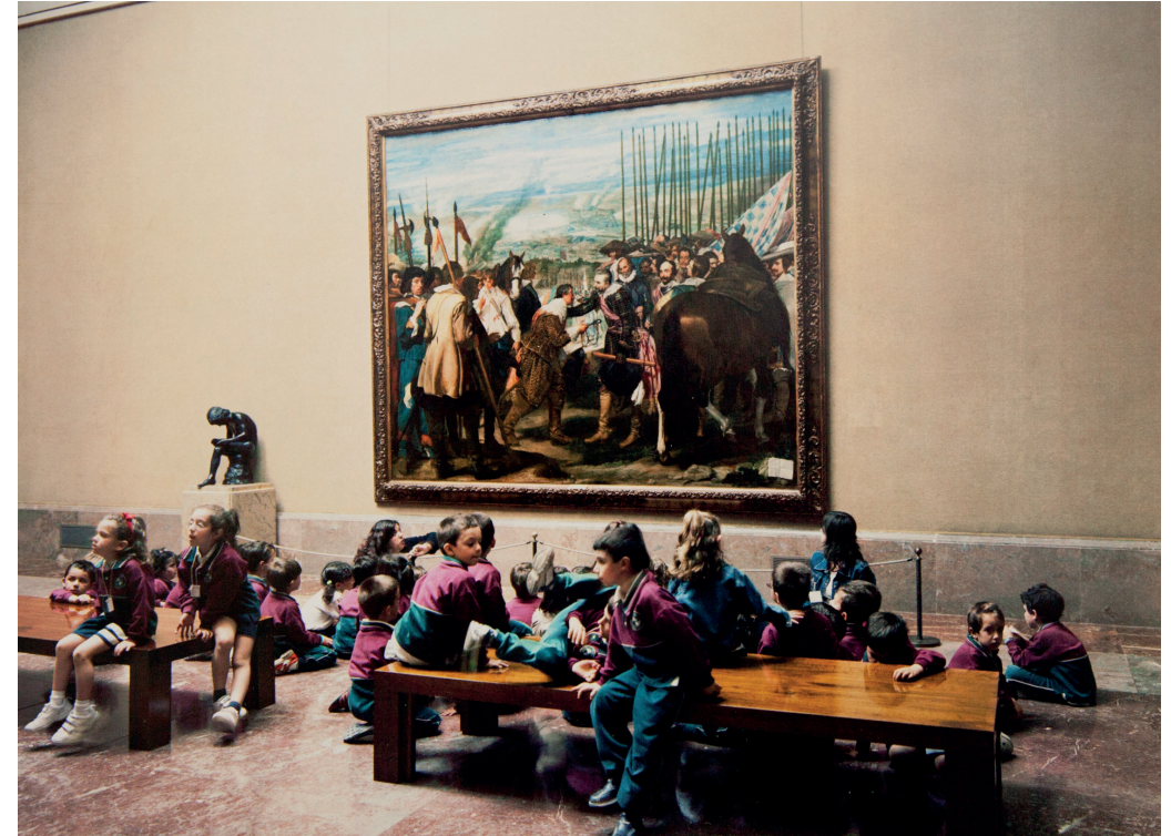
Museo del Prado 1, Madrid, 2005, Thomas Struth