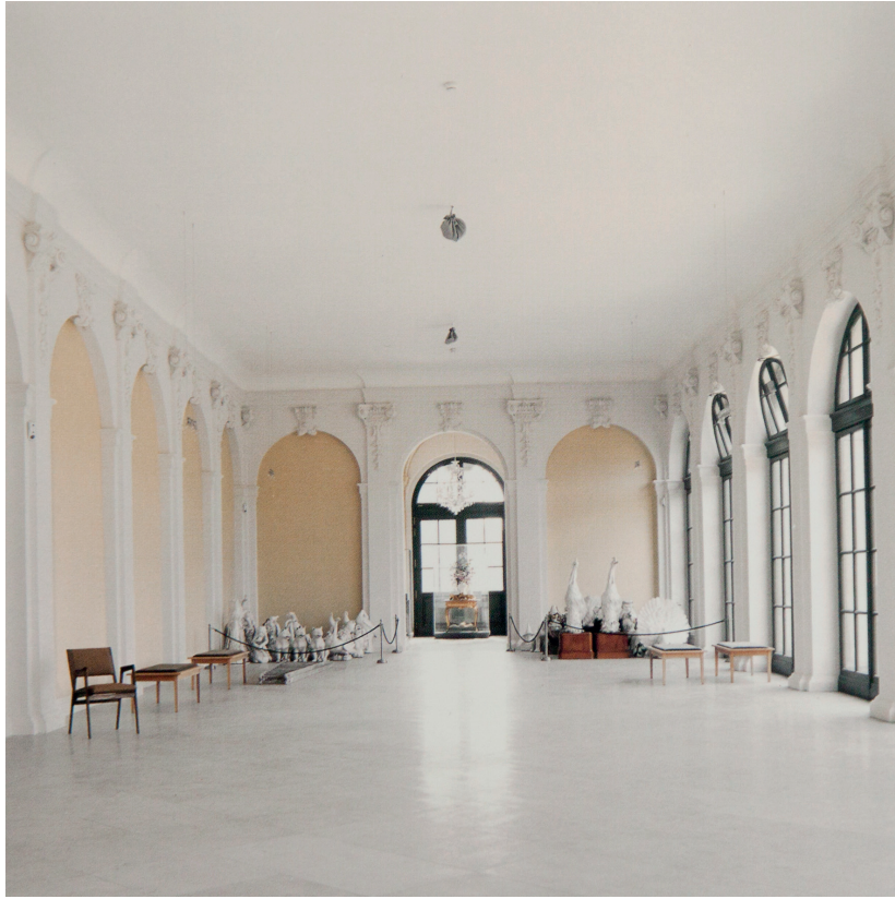
Porzellansammlung Dresden II 2002, Candida Höfer