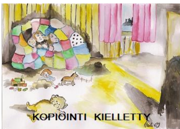
Kuva 2. Pelko