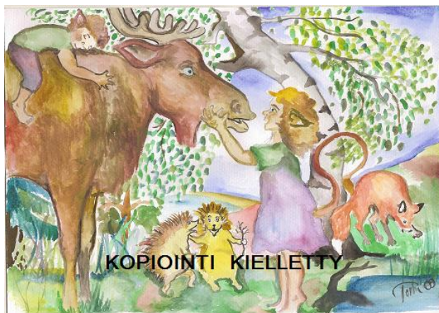
Kuva 7. Ilo