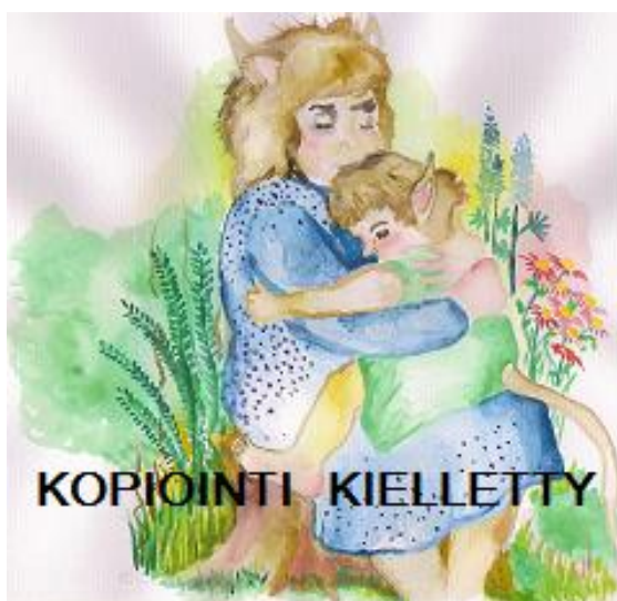
Kuva 6. Hellyys