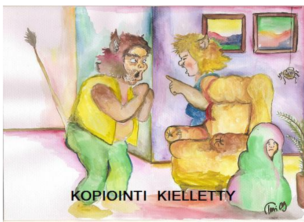
kuva 3. Viha