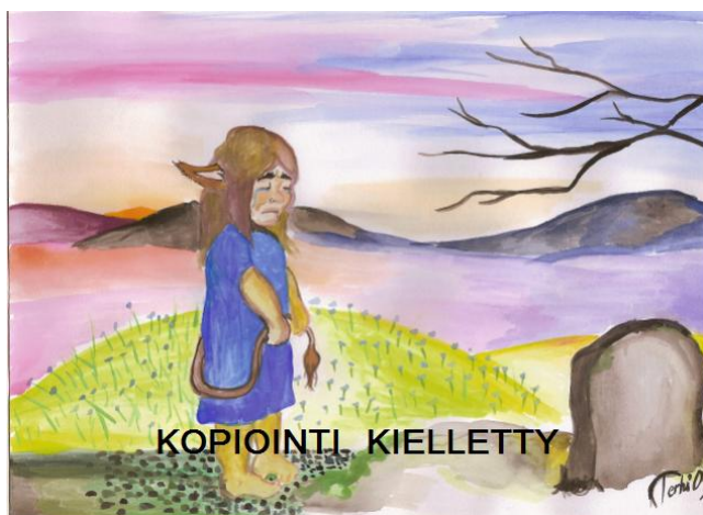
Kuva 8. Suru