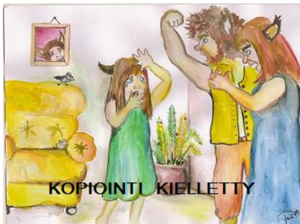
Kuva 4. Viha