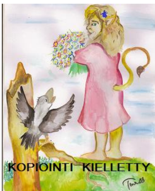
Kuva 9. Ylpeys