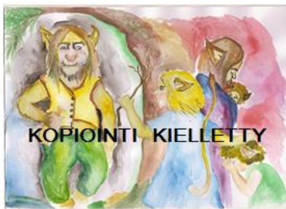
Kuva 1. Pelko