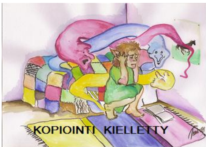
Kuva 11. Harha