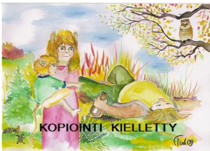
Kuva 10. Pettymys