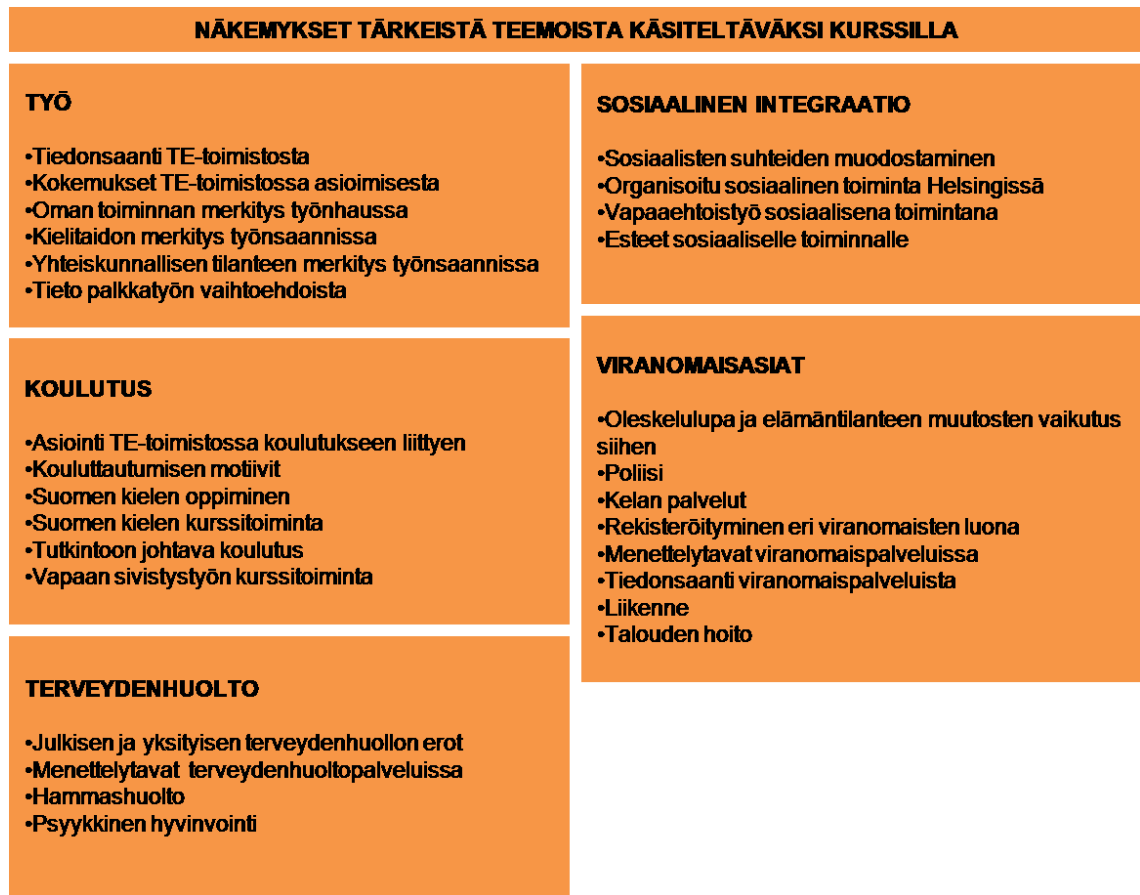
KUVIO 4. Näkemykset tärkeistä teemoista käsiteltäväksi kurssilla, ylä- ja alaluokat