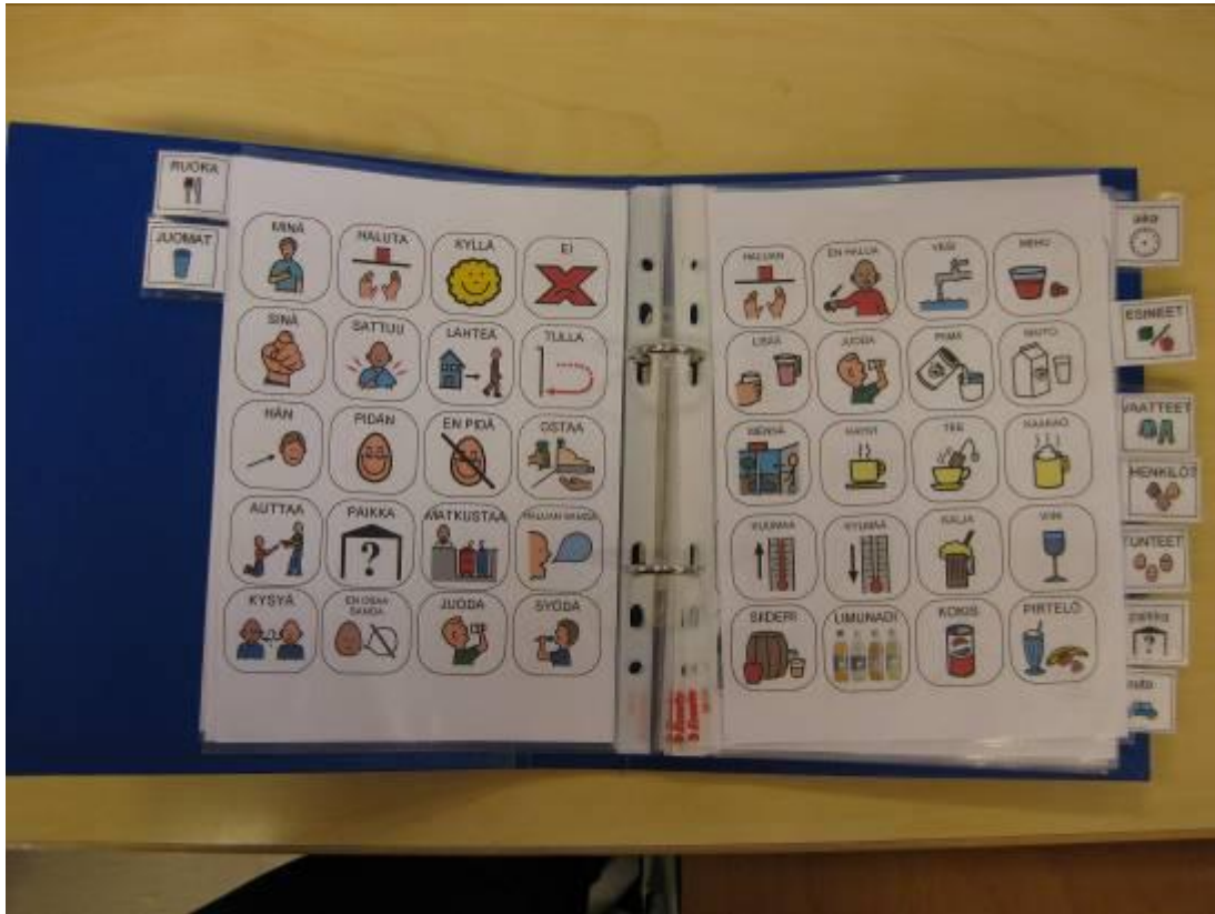
Kuva 5. Tapanin kuvakommunikaatiokansio