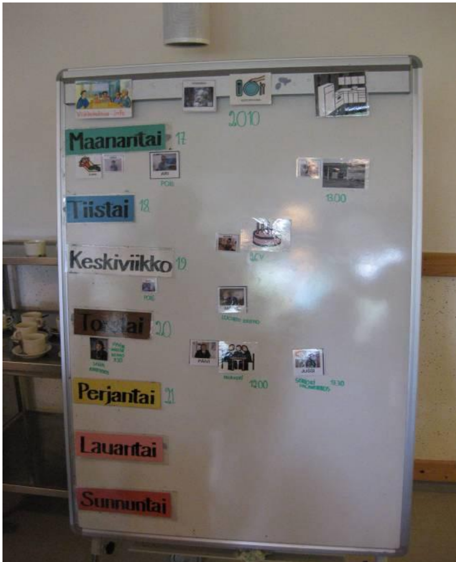
Kuva 2. Infotaulu

Samalla tavalla voidaan kuvilla selventää päiväohjelmat esimerkiksi leirillä. Ojantien toimintakeskuksen syysleirillä ohjelma oli infotaulun tapaan kuvitettuna. Kuvat selventävät päivän rytmitystä ja taululta voi tarkistaa, mitä ohjelmaa on vielä tulossa. Tapanillekin kuvitettu päiväjärjestys helpottaa päivän kulkua ja ymmärtämistä. Tapani seuraa hyvin tarkasti infon etenemistä.