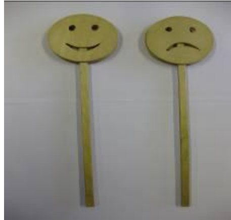
Kuva 4 Hymynaamat

avulla. Jos kappale oli hyvä ja mieluisa, nostetaan hymynaamakeppi pystyyn ja jos kappale ei miellyttänyt nostetaan hymynaama väärinpäin kyltti pystyyn.