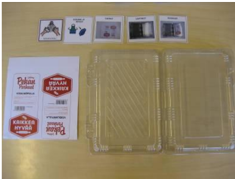
Kuva 6. Mallintaminen

Kommunikoiminen kuvien ja merkkien avulla on hitaampaa kuin puhekommunikoiminen. Vastaanottajalta ja käyttäjältä vaaditaan suurempaa kärsivällisyyttä ja keskittymiskykyä kuin puhekommunikoinnissa. Mukana kommunikoinnissa on aina myös apuvälineitä. Jollekin kuva voi olla ilmaisun väline, toinen tarvitsee kuvaa puheen ymmärtämiseen ja kolmas voi selkiyttää aikaa ja tilannetta kuvien avustuksella. (Huuhtanen 2005, 49.)