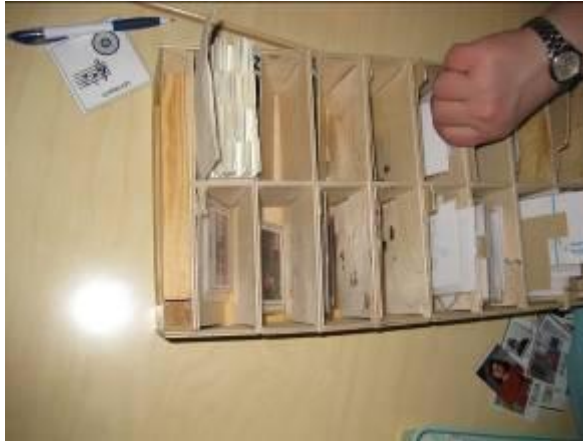
Kuva 3. Lokerikko, jossa on infotauluun kiinnitettäviä kuvia aakkosjärjestyksessä