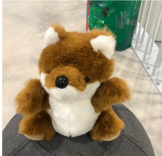
Kuva 3. Karita-Kettu

Toisella kerralla päätimme valita käsiteltäväksi tunteeksi vihan, jonka käsittelyä ryhmän lastentarhanopettaja oli toivonut. Vihan tunneskaala voi ulottua pienestä ärsytyksestä silmittömään raivoon. Viha ilmenee monilla eri tavoilla, esimerkiksi aggressiona, joka on vihan tunteen suora tai epäsuora ilmentymä. Geeneillä on jonkin verran vaikutusta aggressiivisuuden ilmentymiseen. Lapset saattavat myös oppia väkivaltaisia malleja vanhemmiltaan. Väkivaltaan tottuneet lapset voivat ajatella väkivallan olevan toimiva ongelmanratkaisukeino. On todettu, että väkivaltaisten ohjelmien katsominen lisää aggressiivisuutta lasten leikeissä heti katsomisen jälkeen. (Laine & Vilkkö-Riihelä 2012: 30, 33, 38–39.) Vihan avulla lapsi näyttää pahaa oloaan ja omaa tahtoaan. Vanhemmillä on tämänkin tunteen sanoittamisessa tärkeä vastuu. (Kullberg-Piilola & Peltonen 2005: 93–94.)