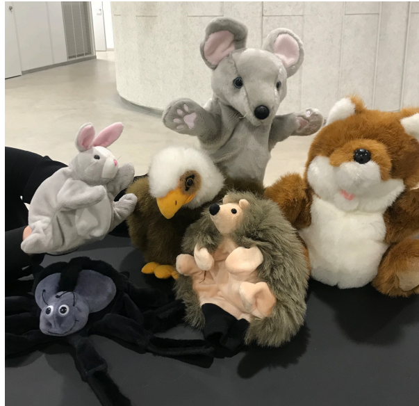
Kuva 8. Yhteiskuva käsinukeista

Käytimme paljon aikaa hahmojen suunnitteluun ja niiden kanssa harjoitteluun. Harjoittelusta huolimatta, vaihdot roolista pois omaksi itsekseen olisi voinut tehdä selkeämmin. Koimme, että välillä omat persoonamme sekoittuivat nukkejen olemukseen. Tämä näkyi esimerkiksi siinä, etteivät lapset muistaneet meidän omia nimiä, vaan puhuttelivat meitä hahmojen nimillä. Muutama lapsi hyvästeli viimeisellä kerralla Hilman, vaikka nukke ei ollut enää näkyvillä. Meillä oli paikoin hankaluuksia pysyä roolissa ja hahmoille suunnitellut ominaispiirteet jäivät muutamaankin otteeseen taka-alalle. Tässä kohtaa tavoitteemme roolissa pysymisestä ei toteutunut. Tämä ilmeni erityisesti tilanteissa, joissa jouduimme keskittymään ryhmänhallintaan ohjauksen eteenpäin viemisen sijaan. Nukkejen käsittely helpottui kuitenkin jokaisella ohjauksella ja niiden kanssa toimiminen alkoi tuntua luontevammalta.