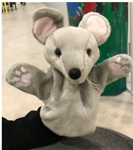
Kuva 1. Hilma-Hiiri

Olimme valinneet toiminnallisen opinnäytetyömme toteutuksen pohjaksi viisi perustunetta, joiden ympärille loimme perustarinan Hilma-Hiirestä ja hänen matkastaan kohti kaupunkia. Valitsimme perustarinan kantavaksi teemaksi tunteiden lisäksi ystävyys. Hilma tapasi matkallaan uusia tuttavuuksia, joihin tutustuimme yhdessä lasten kanssa. Jokainen uusi tuttavuus edusti jotakin viidestä valitsemastamme perustunteesta. Valitsemamme tunteet olivat suru, viha, ilo, pelko ja empatia. Empatian otimme mukaan, sillä se on tärkeässä roolissa lasten tunne-elämän kehityksen kannalta (Kurvinen ym. 2008: 157).