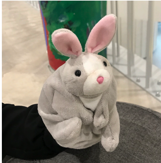
Kuva 6. Perttu-Pupu

Viimeisen kerran teemaksi olimme valinneet empatian, joka on merkittävässä osassa tunneälyn kehittymisen kannalta. Satujen ja tarinoiden avulla voidaan opettaa lapsille toisen asemaan asettautumista. Lasten voi olla helpompi samaistua kuvitteelliseen hahmoon tai eläimeen leikkiverin sijasta. (Kullberg-Piilola & Peltonen 2005: 71–72.) Emme avanneet empatian käsitettä suoraan lapsille, vaan yritimme tuoda sitä esille esitettyjen kysymysten ja tehtävien avulla. Tarkoituksena oli myös kerrata jo aiemmin käsiteltyjä tunteita ja viedä tarina loppuun. Paikalle saapuivat jälleen kaikki kahdeksan lasta. Alkupiirissä kyselimme lasten kuulumisia ja lämmittelyleikkinä toimi tällä kertaa sähköviesti. Pidimme ringissä käsistämme kiinni ja viesti kulki käsien puristuksina koko ringin läpi. Saimme viestin kuljetettua molempiin suuntiin ja lapset tuntuivat pitävän tehtävästä. Koitimme, olisiko mahdollista vaikeuttaa tehtävää siten, että viestin suuntaa saisi vaihtaa puristamalla kaksi kertaa kädestä, mutta tämä ei enää onnistunut.