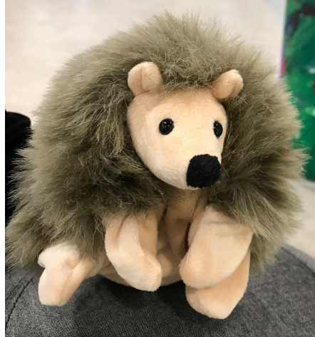
Kuva 4. Simeon-Siili

Kolmannen toimintakerran teema oli ilo. Ilo on yksi perustunteista ja se kuuluu myönteisten tunteiden joukkoon, joita ovat myös onnellisuus ja kiitollisuus. Myönteisellä mielialalla on monia positiivisia vaikutuksia ja sen on havaittu olevan yhteydessä hyvään terveyteen, oppimiseen ja ihmissuhteisiin. Ilon, kuten muidenkin tunteiden kokeminen ja ilmaiseminen, on yksilöllistä ja siihen vaikuttavat ihmisten geenit ja temperamentti. (Laine & Viikko-Riihelä 2012: 44–45.)