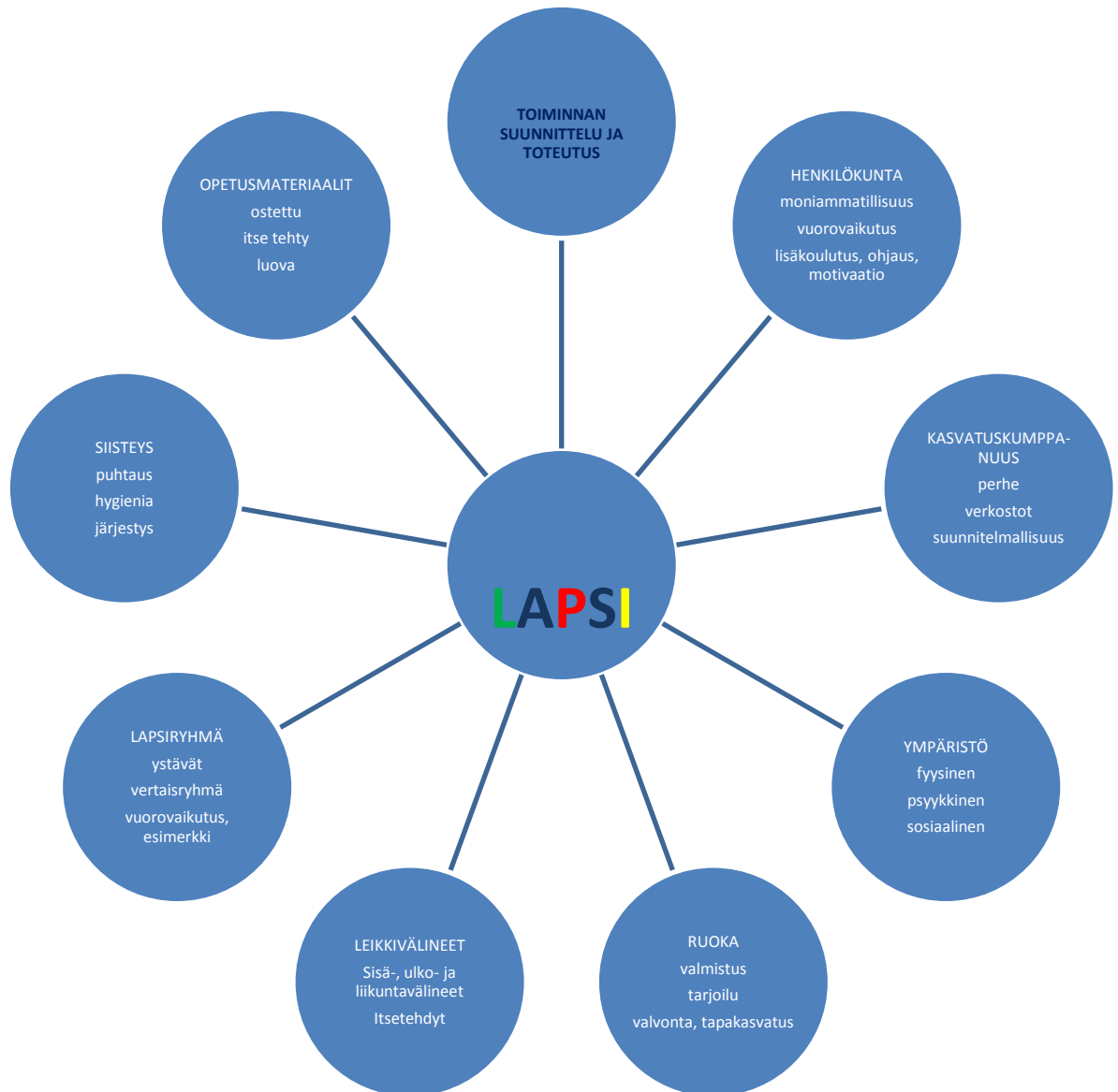
Kuvio 2. Taapero-päiväkotien varhaiskasvatusnäkemys.

Taapero-päiväkotien varhaiskasvatusnäkemysten mukaan kaiken toiminnan keskiössä on lapsi, 0–6-vuotias päivähoidossa oleva. Lapsen tarpeista lähtevät kaikki kuviossa kuvatut yhdeksän osa-alueita, ja kun kaikki yhdeksän osa-alueita ovat kunnossa ja tasapainossa keskenään, Taapero-päiväkodit on luonut lapselle hyvän päivän. Taaperoiden näkemysten mukaan työntekijöiden