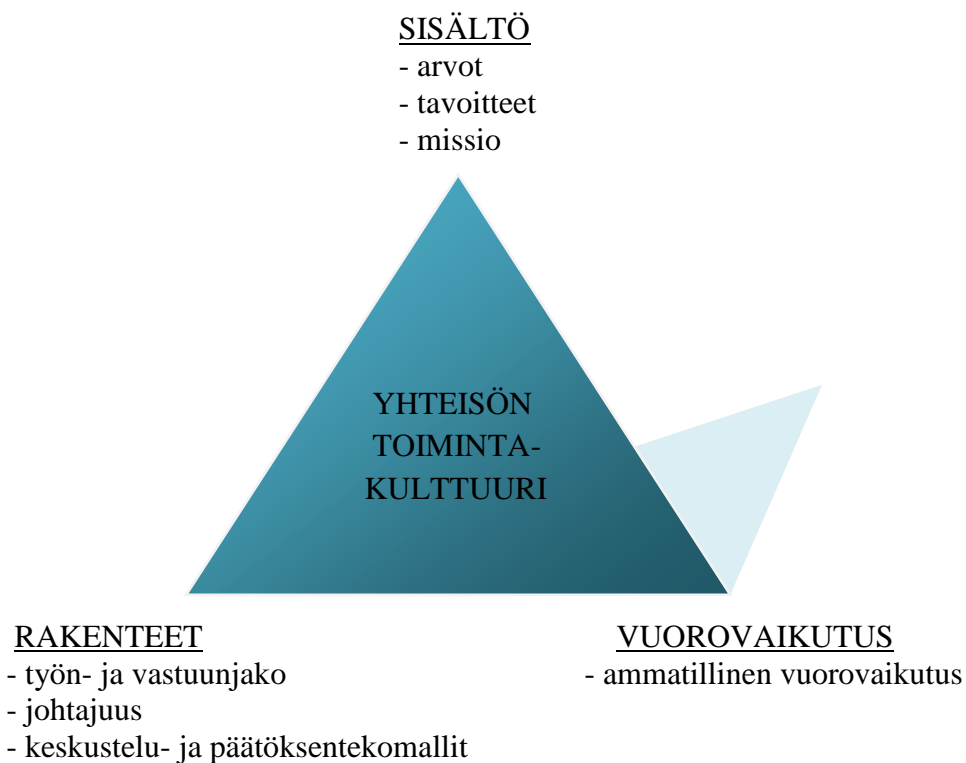
Kuvio 2. Yhteisön toimintakulttuuri.

Tiimiytyminen on yksi vaihtoehto, kun halutaan ammatillista perhepäivähoitoa. Vanhasta mallista, jossa perhepäivähoidonohjaaja on valtaa käyttävä johtaja, pyritään siirtymään uuteen malliin, jossa tiiminvetäjä on niin sanottu sopimusjohtaja. Tällöin tiimin vetäjänä toimii yksi tiimin henkilöistä eli perhepäivähoitaja. Uuden mallin tavoitteena on, että kun tiimit kokoontuvat esimerkiksi kuukausipalaverissa joka kuukausi, aikaa jäisi muuhunkin kuin vain informatiiviseen tiedottamiseen. (Raina-Kiesiläinen 2005.) Opinnäytetyöprojektissani Kannuksen perhepäivähoidossa kyseinen aika käytettiin varhaiskasvatussuunnitelmien työstämiseen.